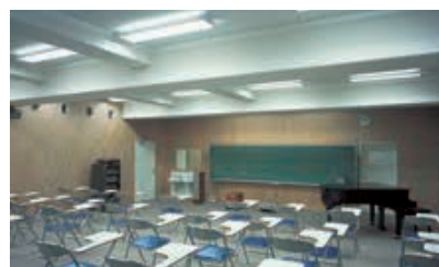
2灯用スクールソフト下面開放直付器具により、優しい視環境を創り出している音楽教室の照明