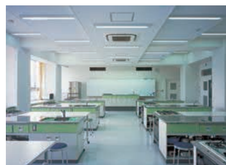
調理室の照明：1灯用スクールソフト下面開放直付器具を採用し、快適な学習環境を形成