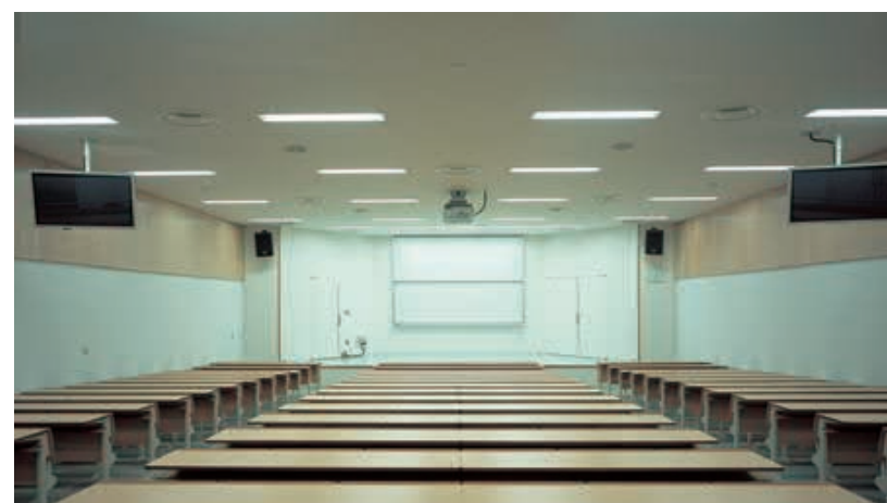
カレッジプラザ(2階講堂)の照明：32WHf蛍光ランプ2灯用埋込器具を整列配置