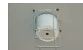
第1体育館のセンサ