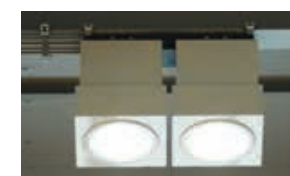
第1体育館のバンクライト