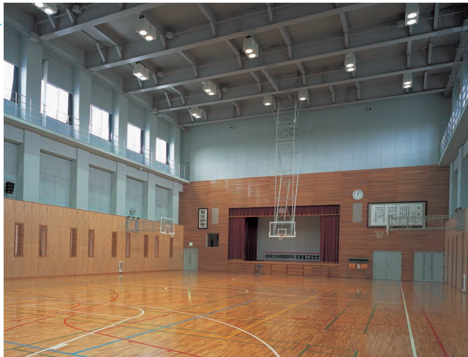
第1体育館の照明：250Wセラミックメタルハライドランプ(ネオセラ)バンクライトを採用し、演色性(Ra:85)のよい視環境を形成しながら省エネを図っている