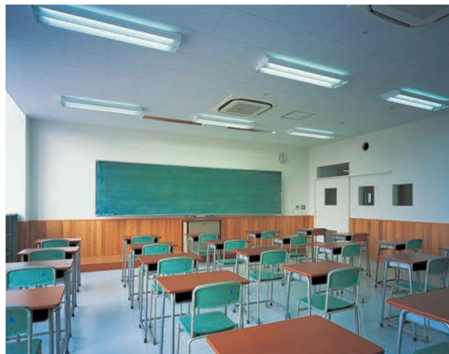
普通教室の照明：2灯用スクールソフト下面開放直付器具を採用し、天井面を明るくして空間に広がり感を高めると共に、机上での読み書きがしやすい明るさを確保