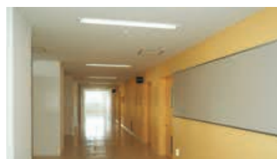
廊下の照明：連続調光形32WHf1灯用埋込器具によりムダな明るさをカットして省エネが図られている