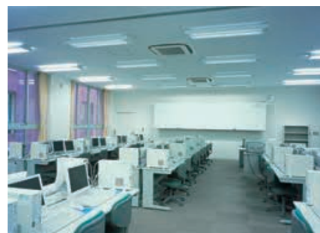
情報教室の照明：2灯用スクールソフトバツフル付直付器具の採用により目の負担を軽減