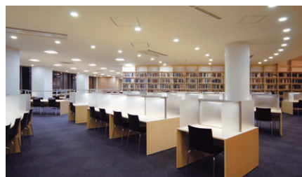
賑やかな雰囲気を創出している図書スペースの照明