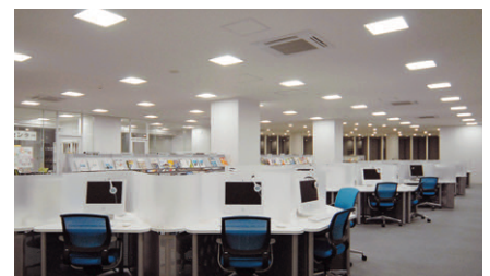
スクエア器具中心の照明で落ち着いた学術情報センター