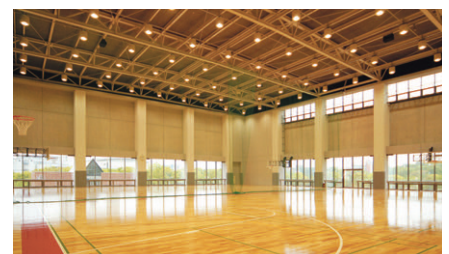
ガラス面の多い斬新な体育館はバンクライトを採用