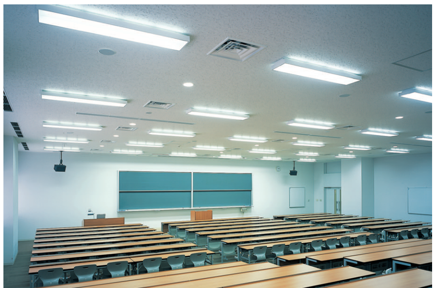
300人教室の照明：ベース照明に32WHf蛍光灯2灯用調光形教室専用直付器具を採用し、初期照度補正制御、昼光利用適正照度制御。プロジェクタ使用時は24Wコンパクト形蛍光灯ダウンライト(30%~100%調光)で対応

体育館の照明は、400Wメタルハライドランプバンクライト(電動昇降装置付)を均等配置し、平均照度750lxを確保しています。