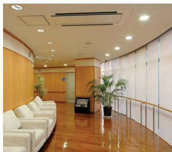
4階待合ホール・ロビーの照明 窓側に32Wコンパクト形蛍光ランプダウンライトを、壁側にはウォールウォッシャータイプ (FHT32W) のダウンライトを設置