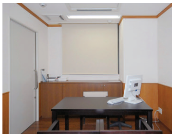
問診室の照明 高出力タイプの2灯用埋込器具(FHF32W×2)でさわやかな空間を演出