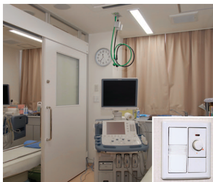
エコー心電図室の照明 乳白カバー付2灯用埋込器具調光形 (FHF32W×2) を採用