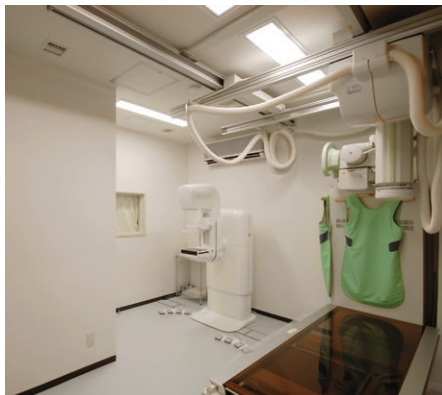
X線室の照明 フラットな拡散光の乳白カバー付の2灯用埋込器具を使用