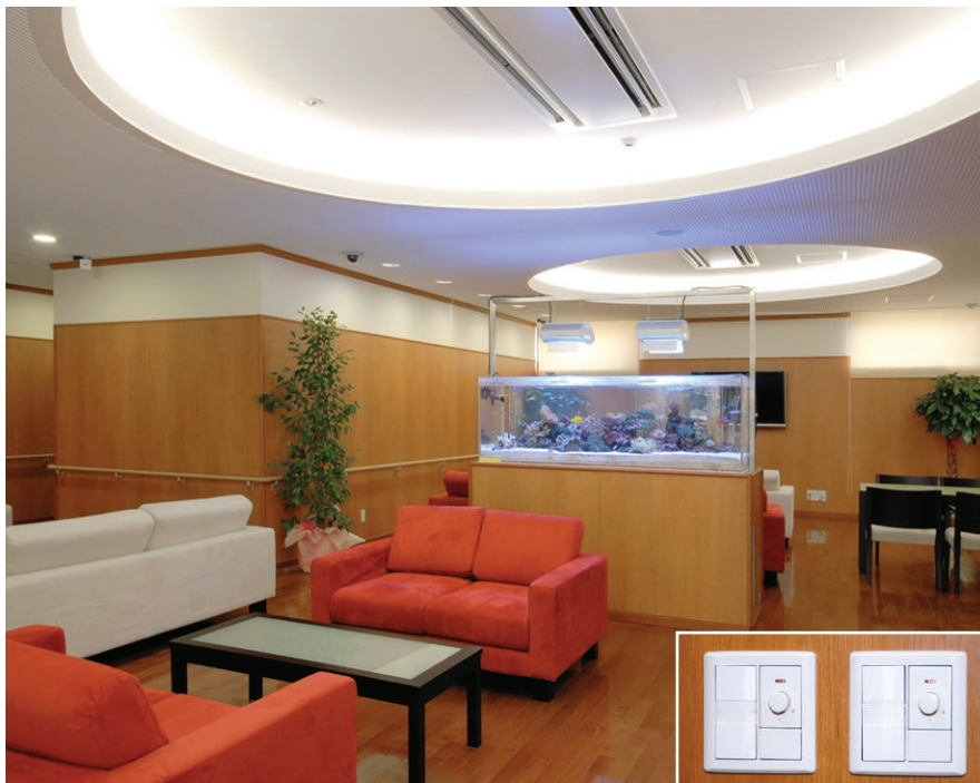
1階ロビー・ラウンジの照明 調光可能なコーニス照明で建築意匠を引き立たせ、安らぎの空間を演出

地下1階に設けられている薬剤合成室の照明は、清浄度クラス100,000以上の条件を満たすため、じん埃の付着や堆積のしにくい構造のクリーンルーム用逆富士形器具(FHF32W×2)を採用し、快適で効率のよい清潔感のある作業環境が得られています。