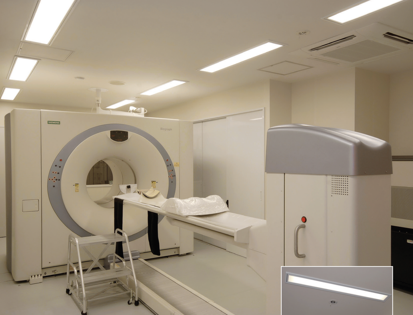
PET/CT室の照明 フラットタイプ乳白カバー付2灯用埋込器具 (FHF32W×2) を壁面に沿って配置。5%~100%調光可能とし、医療に必要な可変の照度の提供と眩しさを抑制