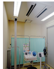
基本検査室の照明 パッフル付の2灯用埋込器具を使用