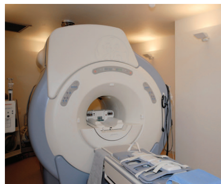
本体アルミ仕様など、特殊仕様の照明器具を採用したMRI室