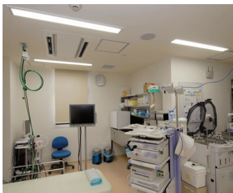
内視鏡検査室の照明 フラットタイプ乳白カバー付2灯用埋込器具調光形を採用