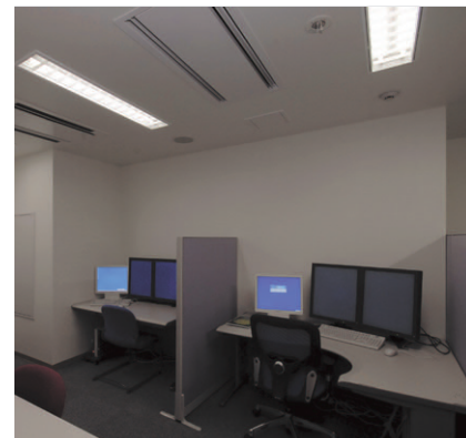
読影室の照明 調光形(5%~100%)の2灯用埋込器具パッフル付を採用