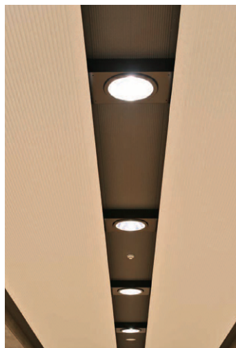
折上天井のスリットライン内の250W形ネオセラダウンライト(C-ebシリーズ)の収まり状態