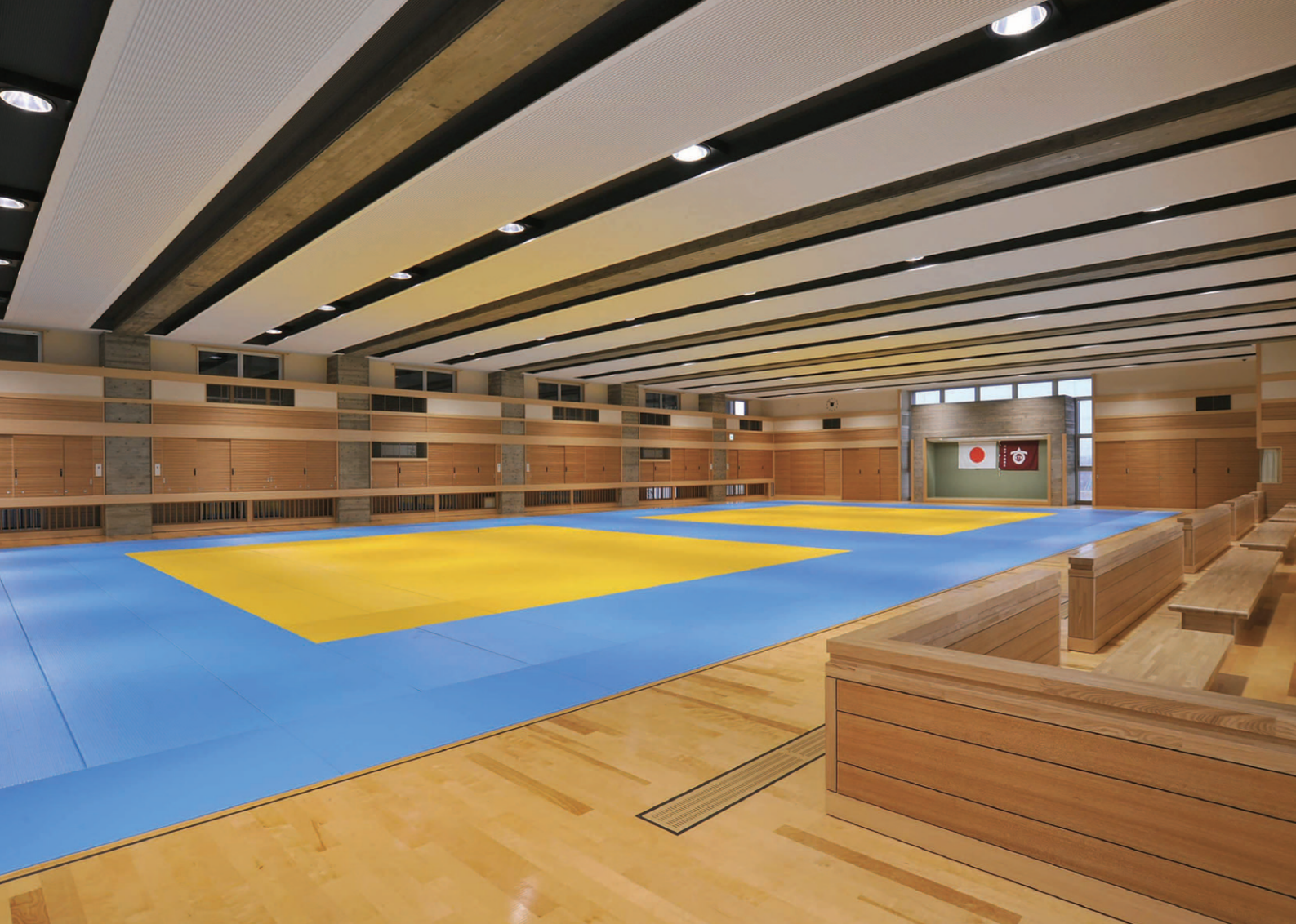
2階柔道場の照明 剣道場と同様に250Wネオセラダウンライト (C-ebシリーズ)電動昇降装置付を採用。照度分布をよくして激しい動きのある競技者を見やすくし、あかりセンサとの連動により、余剰な明るさをセーブして適正照度を確保