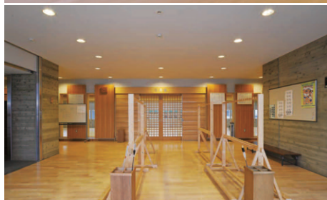
FHT42W2灯用ダウンライト (調光形)を採用した3階弓道場のエントランスホール