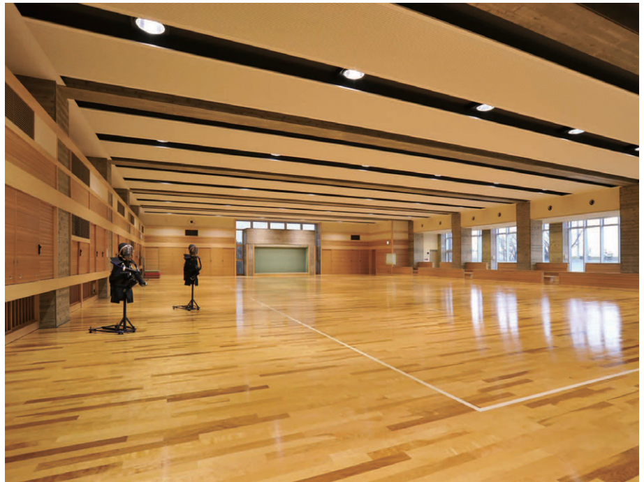
1階剣道場の照明 250Wセラミックメタルハライドランプダウンライトを折上天井のスリットライン内に配置。あかりセンサとの連動により快適な競技空間を確保しつつ、初期照度補正制御で省エネを図っている

矢道の夜間照明は、射場の底上に設置した400Wメタルハライドランプ投光器5台により、追跡照明して矢の軌跡が見やすい良好な光環境としています。的場には150Wセラミックメタルハライドランプ投光器13台を設置し、それぞれの的面を分かりやすく照射しています。