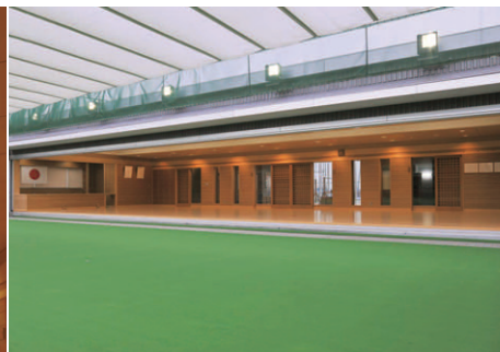
射場の底上に設置された、MF400W投光器5台により矢の軌跡を追跡照明