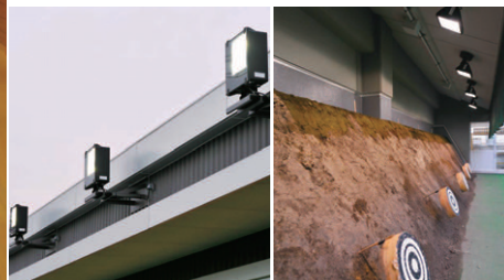
矢道照明のMF400W投光器 射場照明のCDM150W投光器