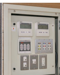
電動昇降装置操作盤