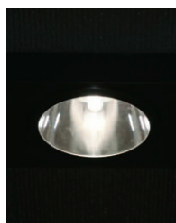
ネオセラ250W ダウンライト