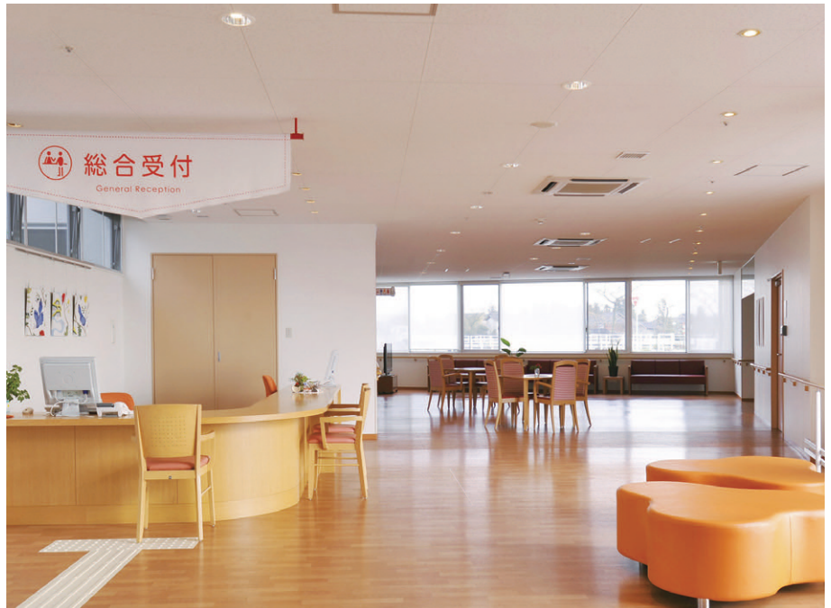
総合受付の照明 ベース照明は24Wコンパクト形蛍光ランプダウンライトを採用し、受付照明および壁面照明には可変形40Wハロゲンランプスポットライトを使用してフレキシブルに照射

自然の中の雰囲気、多目的なイベントが可能な「ぬく森ホール」の照明は、高演色と高効率を両立した150Wセラミックメタルハライドランプ(ネオセラ)投光器を壁上部に設置し、木材の立体トラスを明るく照射。床面やテーブル面への照明には100Wハロゲンスポットを採用しています。機能訓練室の照明は、折上げ天井に埋込スクエア器具カバー付を採用し、拡散光による目に優しいあかりが形成され、安全に治療が行える機能訓練の場をサポートしています。