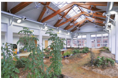
趣味の教室「園芸室」の照明