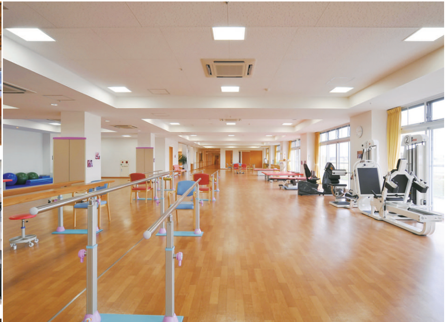
機能訓練室の照明 折上げ天井に設置したFHP32W×3埋込スクエア器具(カバー付)により、拡散光で目に優しい光環境を創出