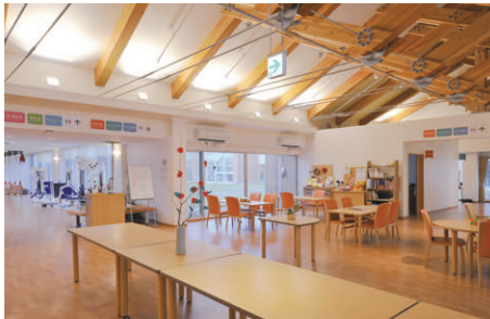
「ぬく森ホール」のキッチンエリア周辺の照明