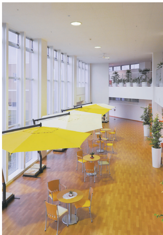
アトリウムの照明 400W蛍光水銀ランプ(ネオスーパー)電動昇降装置付ダウンライトを採用し、快適に演出しつつ、容易なランプ交換が可能