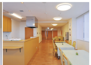
食堂の照明(アットホームな雰囲気演出)