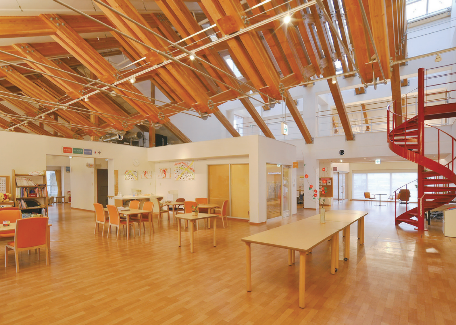
「ぬく森ホール」の全景 自然光に溢れ、木材を多用した温もりのある建築。150Wネオセラスポットライトによる間接照明と100Wハロゲンスポットライトを採用