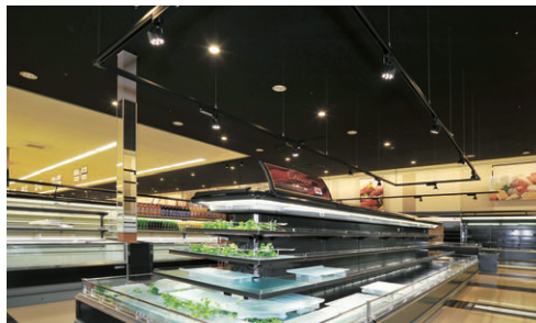
冷蔵デザート売場の局部照明 商品鮮度の保持に配慮し、熱線をほとんど発しないLEDスポットライトを採用