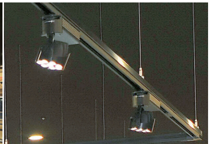
LEDスポットライトは天井から吊下げたライティングレールに設置し、指向性のある光で商品を集中的に照射