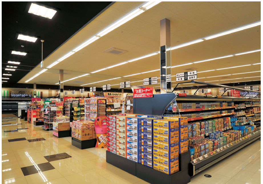
店内中央売場の照明 Hf86W2灯用直付器具の連結設置を商品陳列棚と直角にライン配置し、商品を選びやすい光環境としている

冷凍食品や冷蔵デザート売場には、局部照明としてLEDスポットライト中角タイプ(消費電力23.5W)を使用し、指向性のある光で商品を集中的に照らして、商品を傷めることなく引き立てています。そのほかの照明として、野菜売場の局部照明にはNH250Wロフトペンダントを、レジ周りにはFHP45W3灯用スクエア器具を、休憩/キッズコーナーにはLEDダウンライト6000シリーズなどを採用しています。