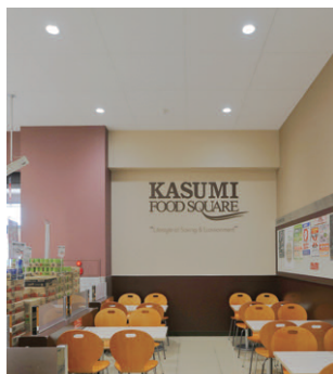
イトインコーナーの照明(LEDダウンライト)