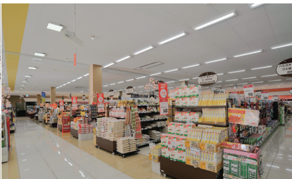
店内中央売場の照明 薄形直付器具「エネカット105」を採用