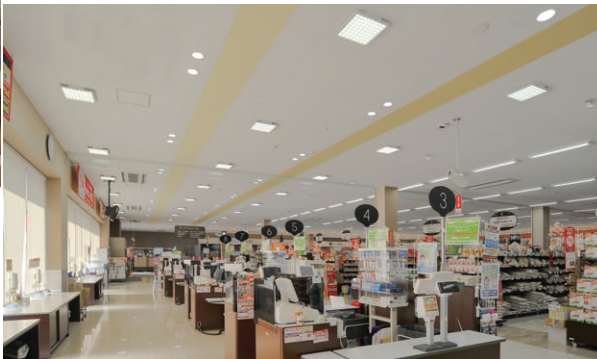
レジ周りの照明 LEDベースライトスクエアタイプとLEDダウンライトを併用