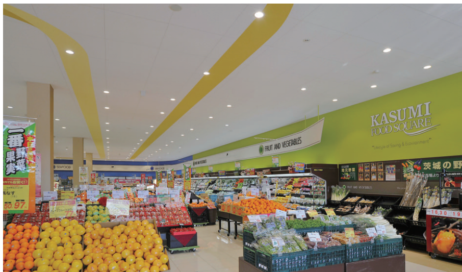
青果売場周辺の照明 平置商品棚用にネオセラユニバーサルダウンライトを採用し、明るく高演色の照明環境を確保

照明制御は、簡易調光システム(パネルコントロール形SESL)を採用し、あかりセンサーとの組み合わせで初期照度補正によるランプ交換時の余分な明るさの抑制や昼光利用制御により周囲の明るさを検知して一定の適切な照明環境を確保しながら省エネを図っています。また、時間帯による必要エリアの調光制御も可能としています。