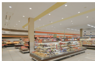
惣菜売場周辺の照明(ネオセラダウンライト)