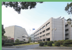
議会棟・事務棟外観

所在地：福岡県福岡市博多区東公園7-7 延床面積：議会棟・事務棟 / 10,080.28㎡ 行政棟 / 77,082.21㎡ 構造・規模：議会棟・事務棟 / 鉄筋コンクリート造、 地下1階地上4階建 行政棟 / 鉄筋コンクリート造、 地下3階地上11階建 照明更新工事：野上電気㈱ 照明更新完成：議会棟・事務棟 / 平成22年10月 行政棟 / 平成23年2月