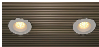
LEDダウンライト900シリーズ