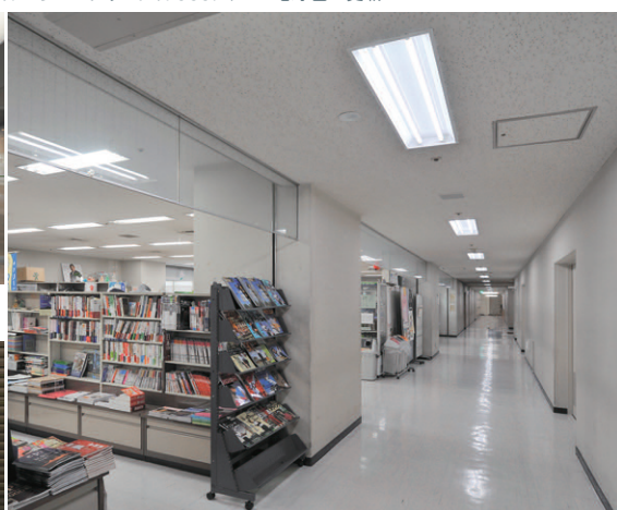
行政棟の各階廊下の照明は直管形LEDベースライト2灯用器具に更新