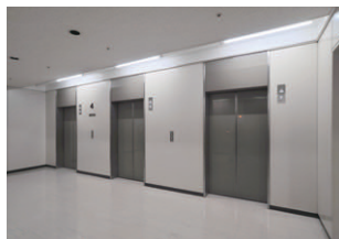
直管形LEDベースライト1灯用器具に更新されたエレベーターホール