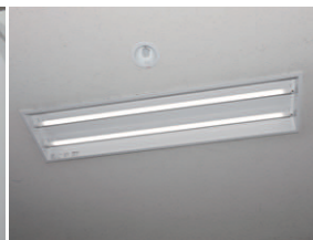
直管形LEDベースライト2灯用器具