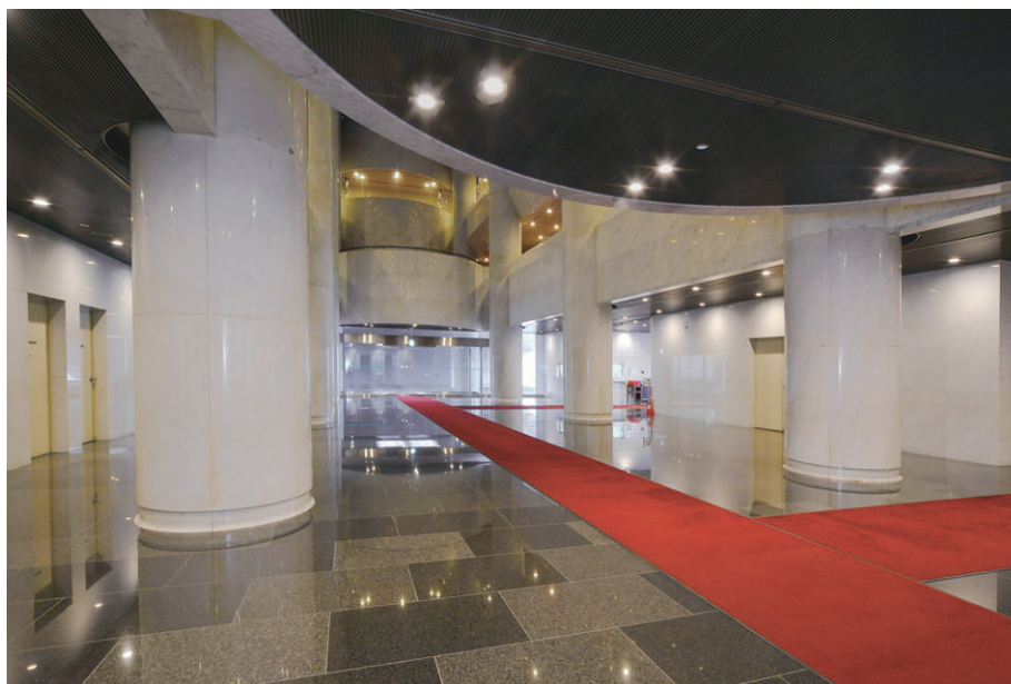
議会棟・事務棟1階の照明 FDL27WダウンライトからLEDダウンライト900シリーズ電球色に更新

現在の福岡県庁舎は、「水と緑の中の県庁」をテーマに昭和56年に竣工した行政棟、議会棟・事務棟、警察棟の3つの棟からなる建物となっています。このうち、今回、議会棟・事務棟の1階と行政棟の共用部の廊下が、LED照明にリニューアルされました。