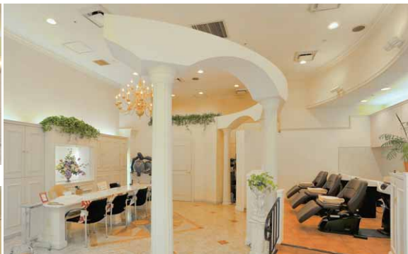
シャンプーブースはLEDライン器具による間接光とLEDダウンライトを配置