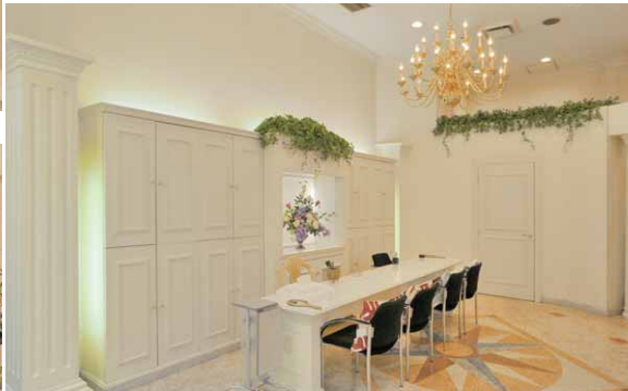
待合スペースはLEDライン器具の間接光と天井面へのLEDスポットライトを配置