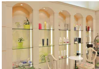
商品ケースにもLEDライン器具による間接照明