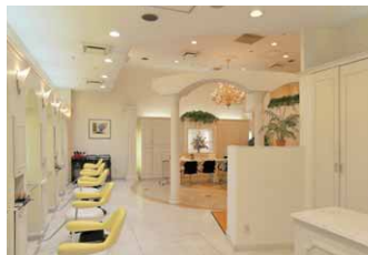
入口側からセットブース方向のLED照明を望む