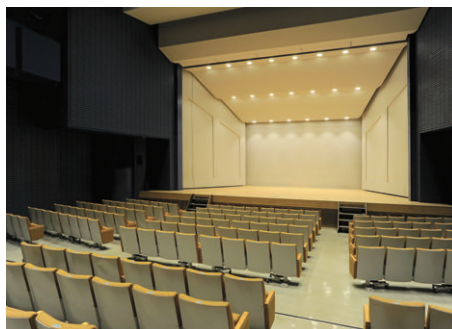
生演奏用の舞台音響天井反射板はLED音響反射板ライトへ更新（客席側から舞台を望む）