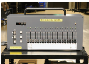
フェーダー数20の舞台袖操作器