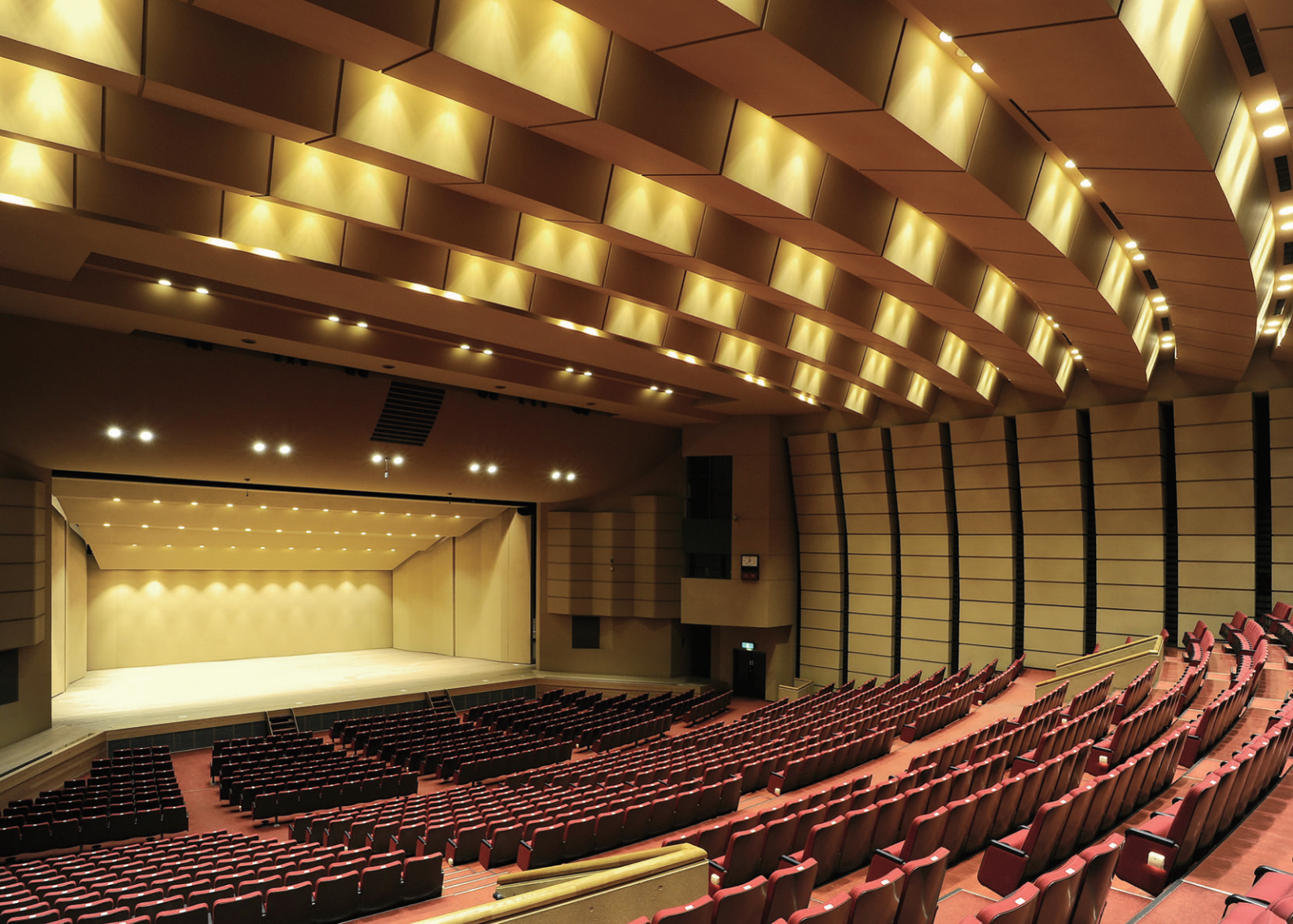
LEDシアター用ダウンライト6000シリーズを採用した市民文化会館大ホールの客席照明(客席側から舞台を望む)