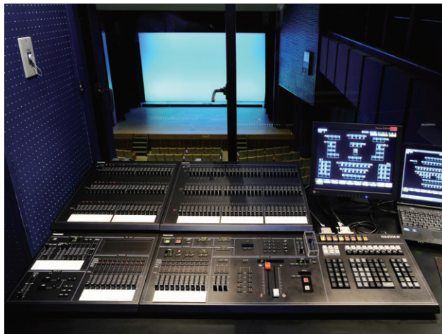
コンパクトながら3段フェーダーを備えた高機能な調光操作卓、TOLSTAR-III TypeF