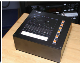
フェーダー数10の舞台袖操作器