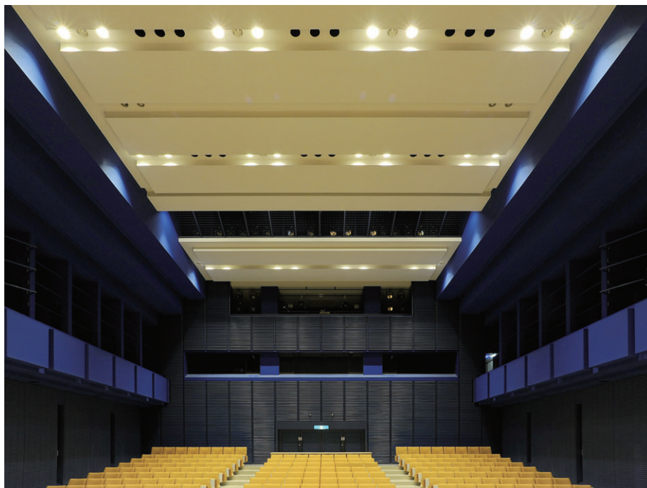
LEDシアター用ダウンライト6000シリーズを採用した南部公民館の客席照明（舞台側から客席を望む）

調光操作卓は、制御チャンネル512chで、仕込み、再生方法の操作は文化会館用と同仕様のTOLSTAR-III TypeFを採用。TFTモニターやノートPCなどによりホール負荷変動に合わせたレイアウトをグラフィック化し、調光レベルの閲覧を可能にしています。