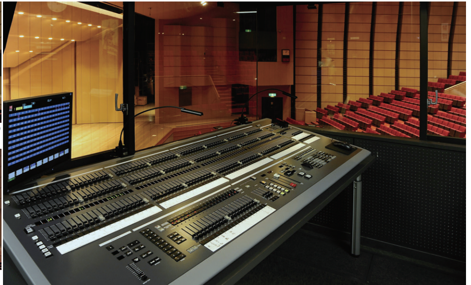
調光操作卓 LICSTAR-IV TypeJ