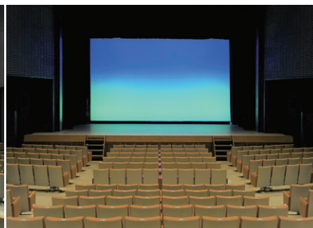
ハロゲンライトによる舞台照明もリニューアル（客席側から舞台を望む）