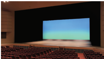
ハロゲンライトによる舞台照明もリニューアル(客席側から舞台を望む)