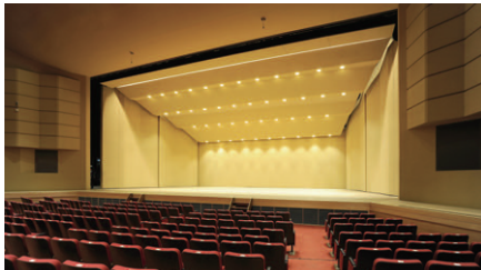
間口19m×奥行14m×高さ8mの舞台、天井反射板に44台のLED音響反射板ライトを設置