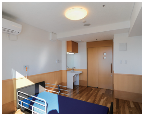
居室は手で調光・常夜灯などに切り換えられるホームライトを採用