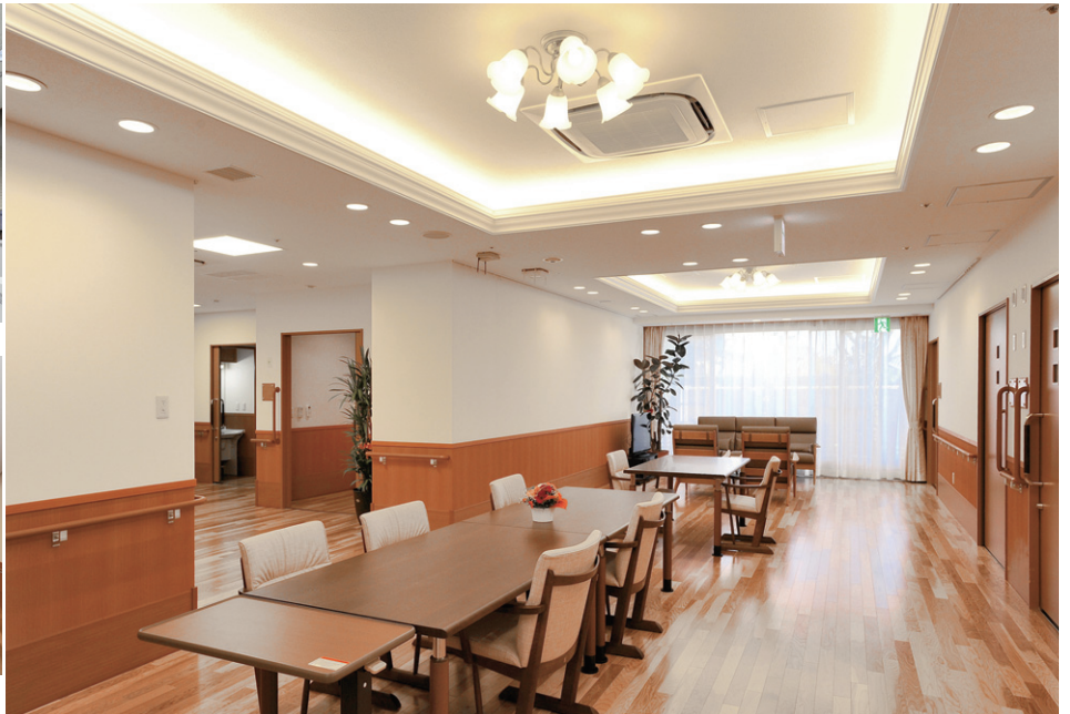
1階共用部リビングの照明は、エントランスホールとの連続したイメージをつくるため、エントランスと同様の照明手法を採用