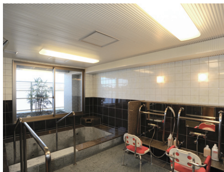
浴室には蛍光灯業務用浴室灯を採用