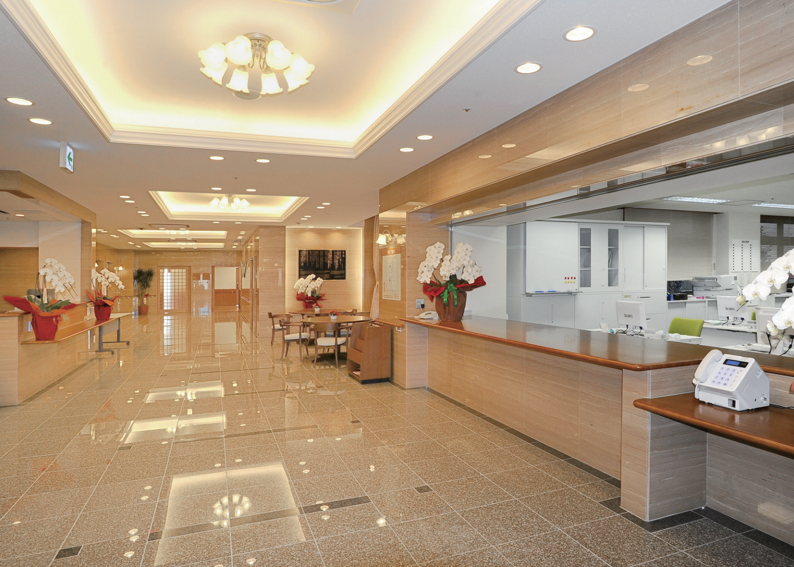
1階エントランスホールの照明 連続した掘り上げ天井の建築化照明とその中央にはシャンデリア、平天井部にはLEDライトエンジンダウンライトを配置