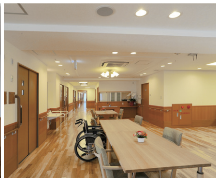
2階の共用部リビングは間接光とLEDダウンライト、シャンデリアで構成