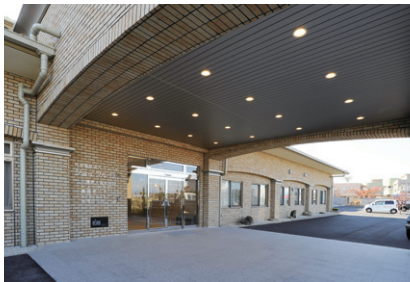
LED軒下用ダウンライトを配置したピロティ