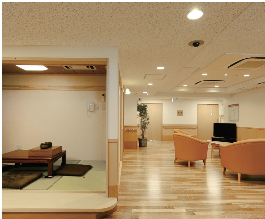
3階の共用部リビングには自在性の高いLEDライトエンジンダウンライトを採用。和室にはホームライトを設置

1階食堂の照明は、広くとった掘り上げ天井を電球色の建築化照明として、その内側にFHP45W3灯用埋込カバー付器具を4台配置。方向性をもたない拡散光により和みを与える印象に加え、目の負担を軽減して、明るく会話が弾む雰囲気を創出しています。