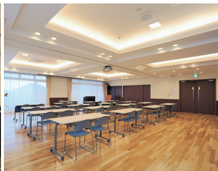
1階食堂は建築化照明と蛍光灯スクエア器具に加えLEDダウンライトを配置