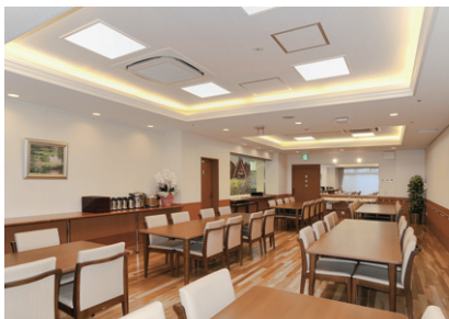
1階食堂の照明 間接照明と中央に蛍光灯スクエア器具を配置