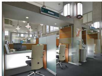
LED照明で明るくした窓口カウンター周り