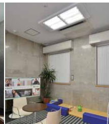
待合スペースのLED照明