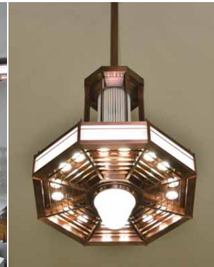
LED内蔵の大型シャンデリア吊下形