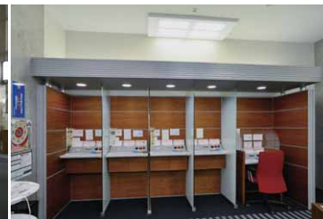
記帳台周りのLED照明