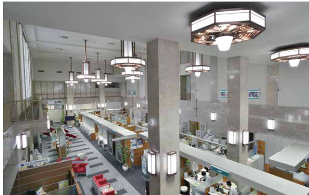
2階メンテナンス通路から見る店内の様子