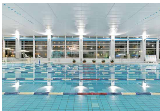
窓側に設置されたLED投光器の照明