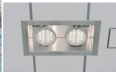
2灯セットで8台のLED投光器を設置