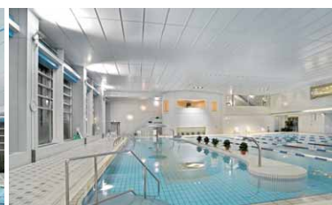
小児用プール周辺の照明