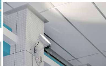
窓側のLED投光器は天井に向けて照射