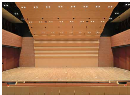
舞台を正面から望む