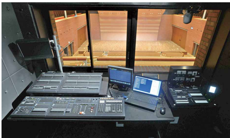
調光操作卓 TOLSTARⅢ TypeF