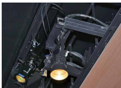
観客席のLEDシアター用ダウンライト