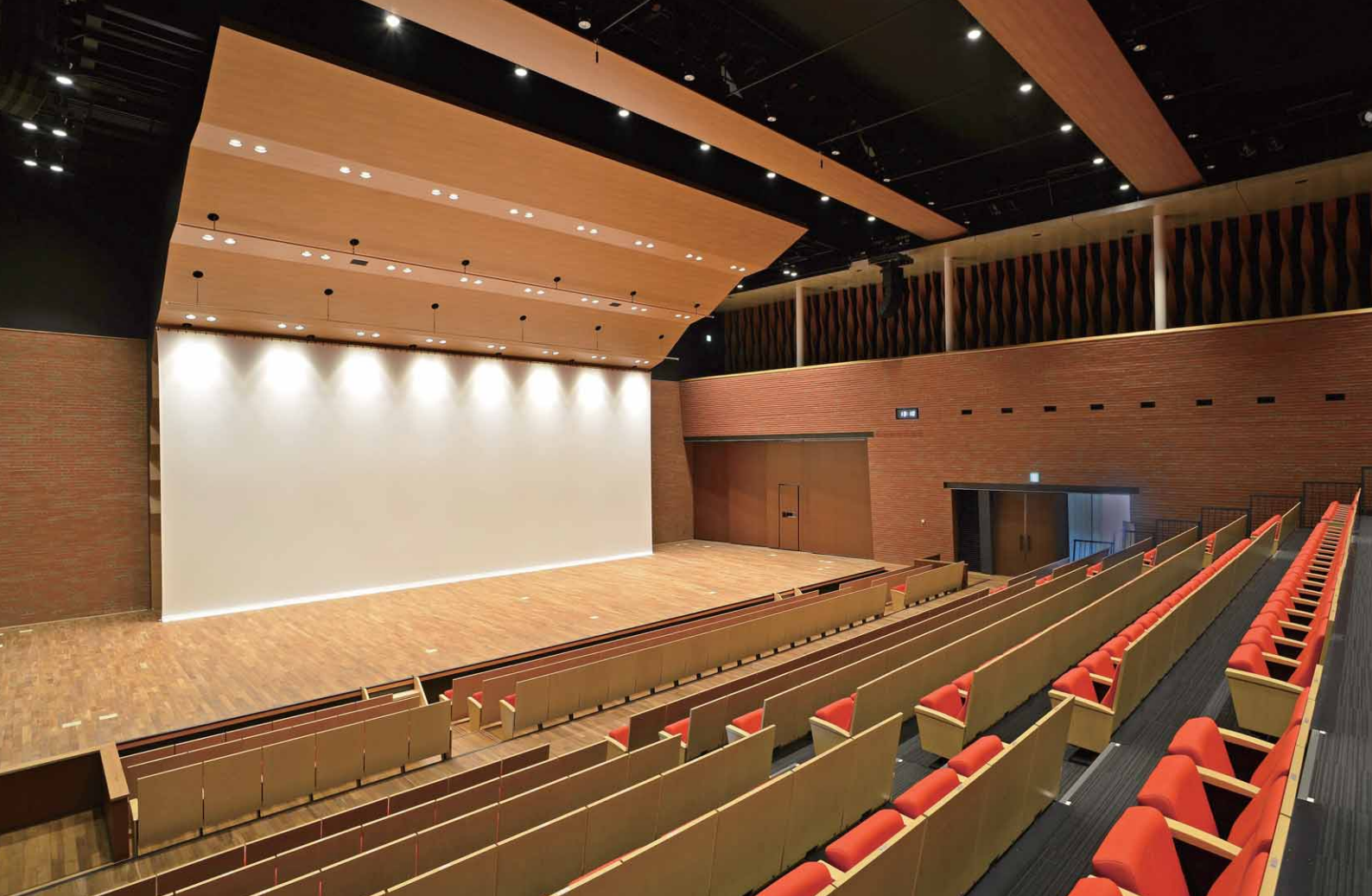
天井反射板にはLEDシアター用ダウンライトを採用