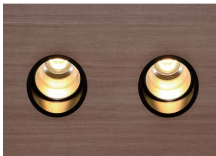
天井反射板のLEDシアター用ダウンライト