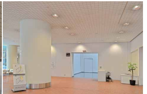
LED一体形ダウンライト6000シリーズを採用したエントランスホールの照明