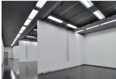
直管形LEDベースライト3灯用(特注)を壁面にライン状に配置し、その中央を交差する形で2台を並列配置した第2・第3展示室(左)と第4・第5展示室(右)