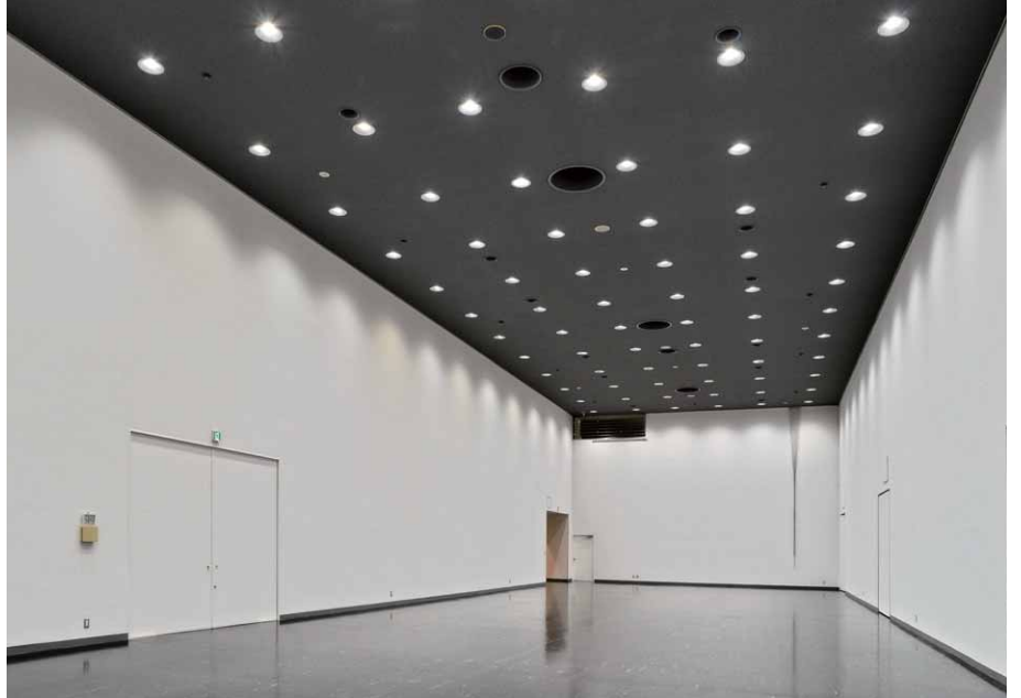
高天井となっている第1展示室は明るく均一な発光で自然な陰影を実現するLED一体形ダウンライト9000シリーズを採用

ギャラリーを照明リニューアルするに当たり検討されたことは、①紫外線や熱による展示作品の損傷防止保護、②光源は自然光に近く、高い演色性を確保、③ランプ交換の手間の軽減化、④消費電力削減の実現化、⑤瞬時点灯・瞬時再点灯可能とする光源利用、などでした。これらの結果、紫外線はほとんど含まれず発熱も少なく、かつ省エネの代名詞といわれるまでになったLED照明の採用を原則とし、彫刻などの高さのある展示物を中心とする天井高7.5mの第1展示室には、器具光束7,200lmのパワフルな明るさで、相関色温度5000K、平均演色評価数Ra90のLED一体形ダウンライトを採用し平均照度2500ルクスを確保。視野内の輝度分布もよく、影やモデリングも良好な展示空間としています。絵画・書道・イラストなどの作品が展示される第2・第3展示室、および七宝体験教室や盆栽展覧会等を行う第4・第5展示室は、直管形LEDベースライト・Hf32W高演色タイプ3灯用相当(特注)を採用。ランプ光束2,625lm、平均演色評価数Ra93を使用し、自然に近い光(相関色温度5000K)で展示物を再現、平均照度1700ルクスを得ています。具象画展や東海道五十三次展等が開催される2階の展示ホール1・2は、LEDベースライトスクエア器具(FHP32W3灯用器具相当)を均等配置。壁面照明としてLEDスポットライトを採用し、壁面展示物のそれぞれに集光させて作品を魅力的に演出しつつ、来館者にとっては疲れが少なく快適に観賞できる照明環境をつくり出しています。