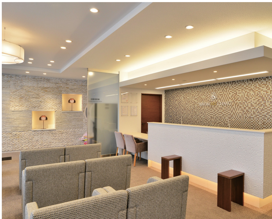
電球色のLEDベースライトTENQOOシリーズ間接照明とLEDライトエンジンダウンライトにより温かみのある雰囲気を出した総合受付

照明は、優れた省エネ性とメンテナンスフリーを特徴とするLED器具を採用し、医療に関する診察室、処置室、検査室などには顔・肌色が自然に見える昼白色(5000K)・演色性Ra83を採用し、用途に応じてパッフル付または乳白カバー付、および仰向けになったの診察を要する部屋には調光タイプ(約5~100%)と使い分けて配置しています。手術室Ope.roomや採卵室O.P.Uは清浄度が要求されるクリーンルームであるため、気密性に優れ、ほこりが溜まりにくくて耐薬品性のあるLEDベースライトTENQOOシリーズクリーンルーム用器具半乳白強化ガラスカバー付を採用。手術台または治療台を囲む形で壁面側に配置し、集中的に治療できるよう高照度でサポートしています。特に採卵室には口の字配置とした同器具の四隅に調光可能なLEDライトエンジンダウンライトクリーンルーム用器具を設置し、一人ひとりの受診者に合わせてリラックスした光空間の中で採卵を行えるよう配慮しています。待合ロビーや廊下、リカバリー室などでは、少しでも受診者のストレスを軽減できるよう、温かみのある電球色のLEDベースライトTENQOOシリーズを用いた間接照明とLEDライトエンジンダウンライトによりやさしく包み込む安らぎの空間を創出しています。