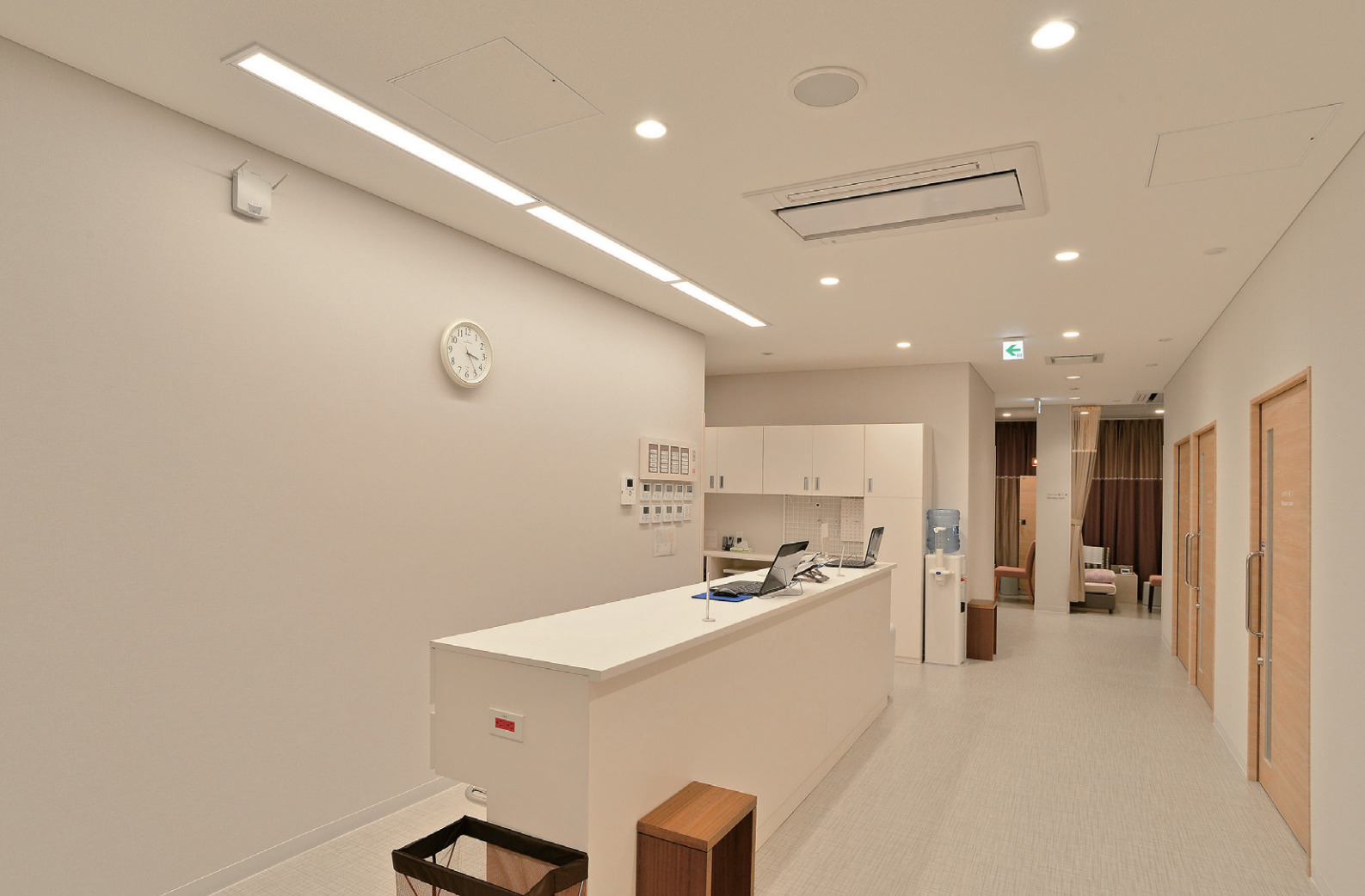
2階のARTフロアの照明 LEDライトエンジンダウンライトをベースに、壁面に沿ってLEDベースライトTENQQシリーズを連結設置