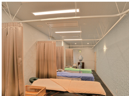
TENQOOシリーズを各ベッドに配置した統合治療室