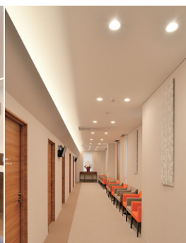
診察待合室のLEDダウンライトとLED間接照明