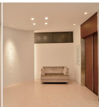
エレベーターホールのLEDダウンライトとLED間接照明