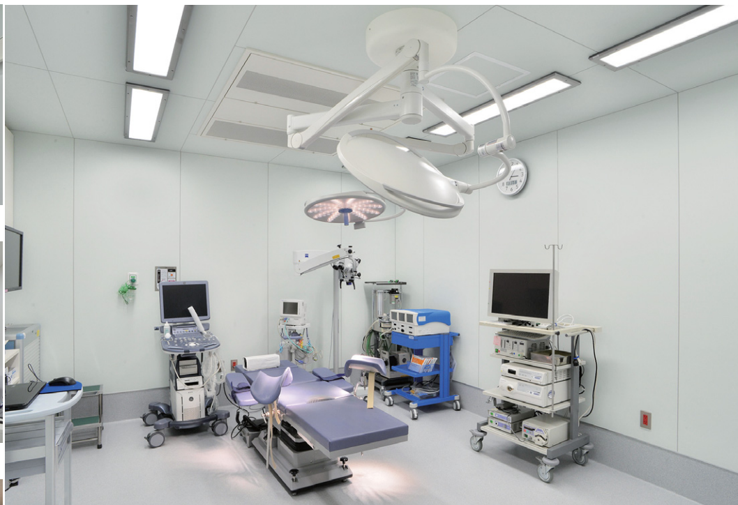
手術室Ope.roomの照明 クリーンルーム用器具を手術台の両脇へ壁に沿って配置