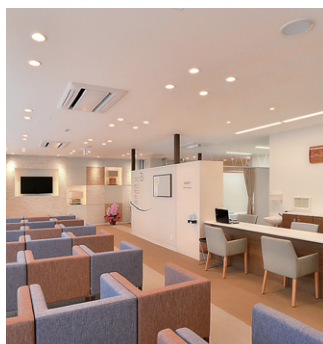
採卵待合ロビーのLED照明