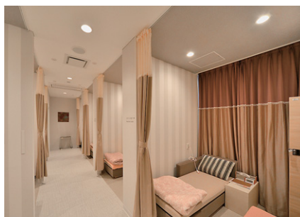
グレアレスのLED照明を用いたリカバリー室