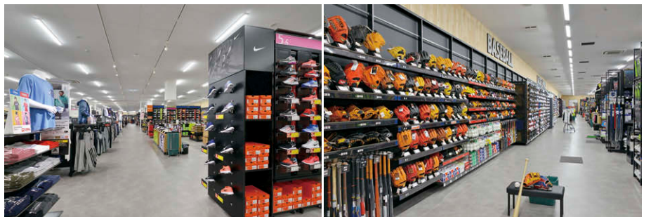
店内奥の通路からメンズウェアコーナーを望む照明