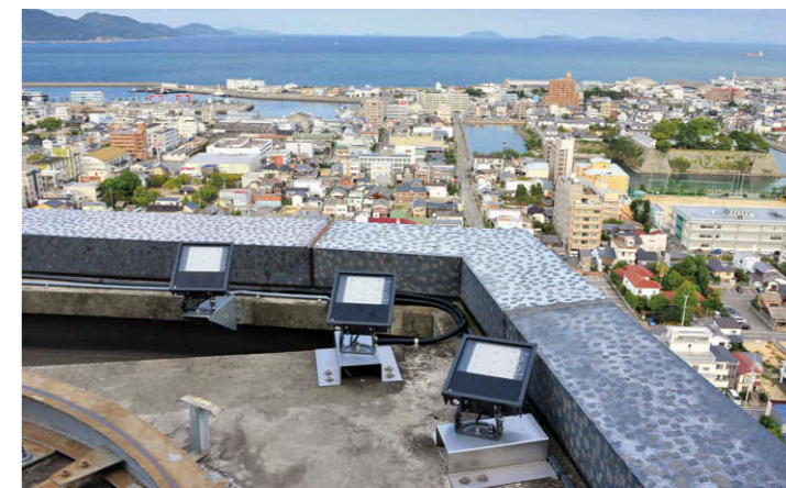
ペントハウスのライトアップ器具 700W 形水銀ランプ器具相当 LED 小形角形投光器 ⑤⑥⑦ を屋上に計 32 台設置し、壁面約 250 ルクス、屋根約 600 ルクスの平均照度を確保