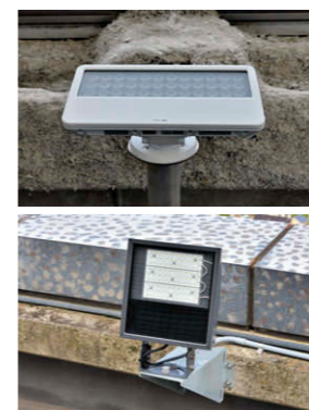
③ ルミライナー D フルカラー LED フラッドライト ColorBlast Powercore gen4