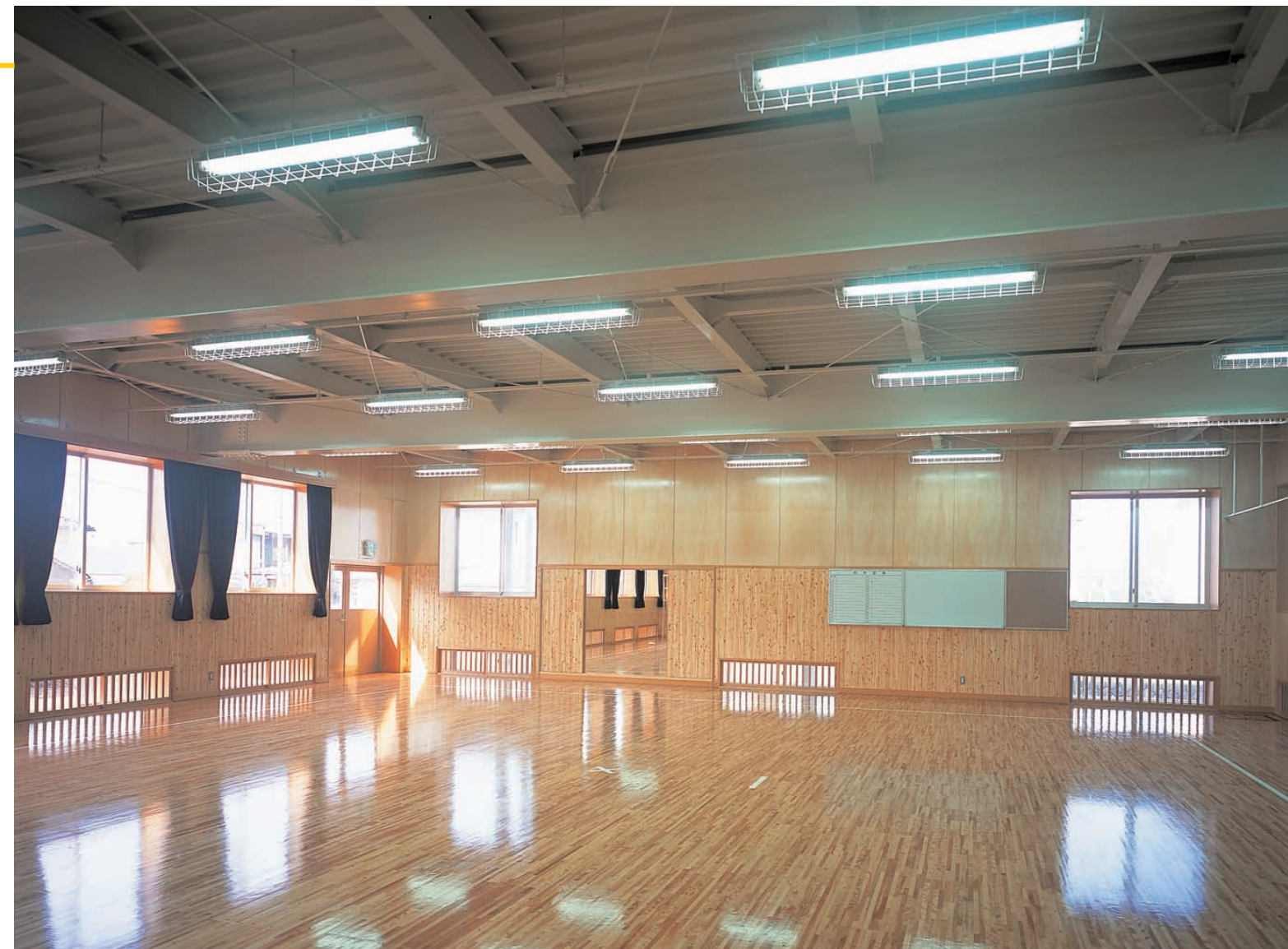
剣道場：Hf32W2灯用直付反射笠器具を配置し1,000 lxの照度を得ている Kendo training gym