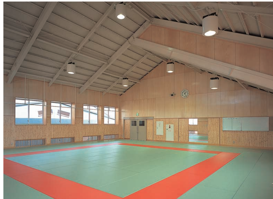
2階柔道場：400Wメタルハライドランプ仕様のバンクライトで照明されている Judo training gym on 2nd floor