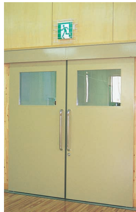
誘導灯：剣道場の出入口に取付けられている高輝度誘導灯 エクセリド・L Guide lamp