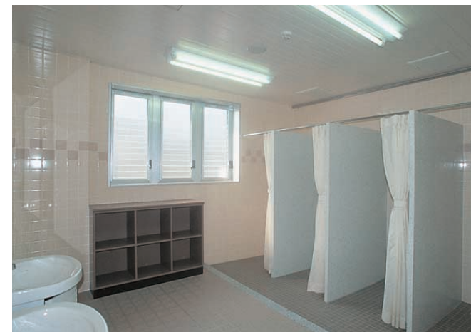
1階シャワールーム：40W蛍光灯2灯用逆富士形防水器具を設置 Shower room on 1st floor