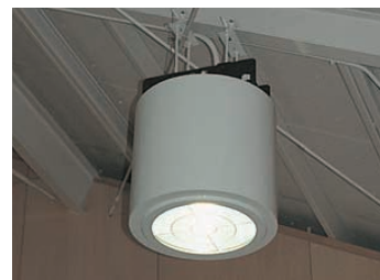
バンクライト：安定器同時昇降タイプのバンクライトの吊下げ配置状態 Bank-light