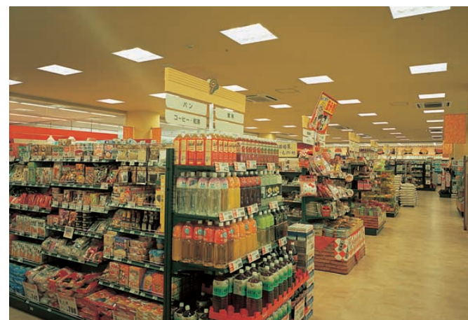
グロッサリーエリア Grocery area 4灯用スクエア器具(パッフル付)を均等配置。無方向で均等配置のため、まぶしさのない、均斉度のよい照明空間が実現している