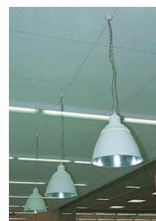
高効率メタルハライドランプフロフトペンダントの器具アップ Closed-up photo of high-efficient metal halide lamp loft-pendant lighting apparatus