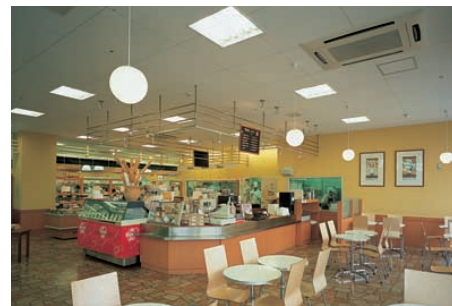
イトインコーナー Eat-in corner スクエア器具のベース照明と、客席部に丸形グローブペンダント器具を使用し、くつろぎ感をつくり出している