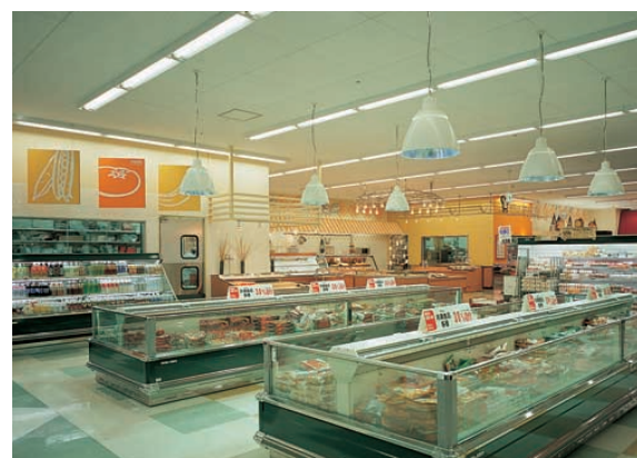
冷凍食品コーナー Frozen food corner 高効率メタルハライドランプフロフトペンダントを使用。下方向主体に集光して商品の見やすさを配慮している