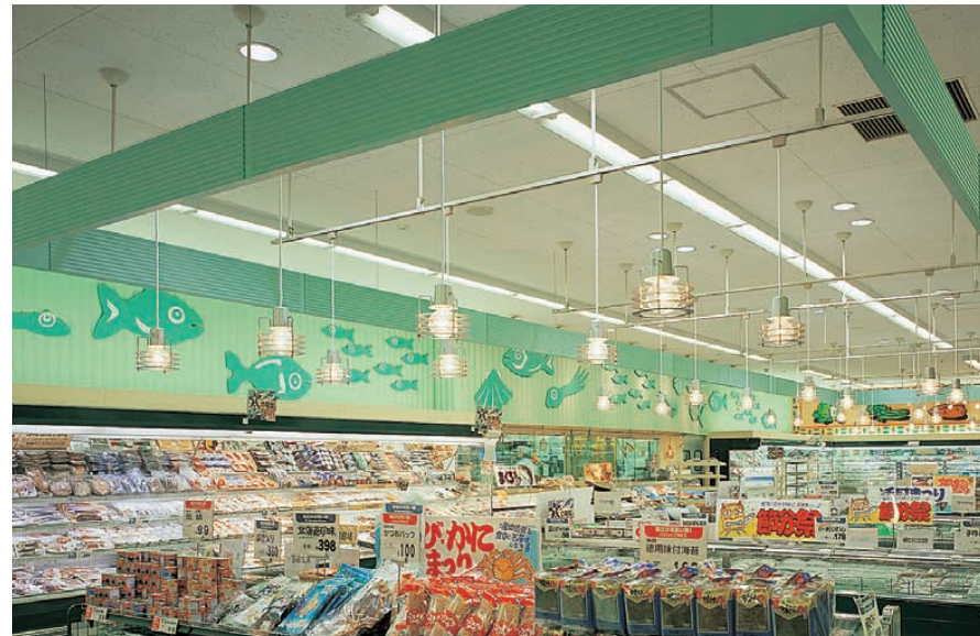
鮮魚コーナー 天井からの昼光色(4500K)ダウライトと透明電球で、青く透明な雰囲気をつくり出し、一段と新鮮さを強調している Fish corner