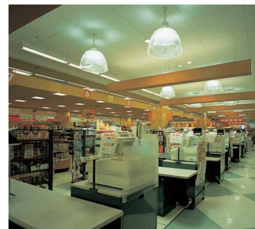
レジエリア Register area ネオアークビームダウライトと高効率メタルハライドランプフロフトペンダントにより、自然なあかりで高照度(平均照度2,000lx)が得られている