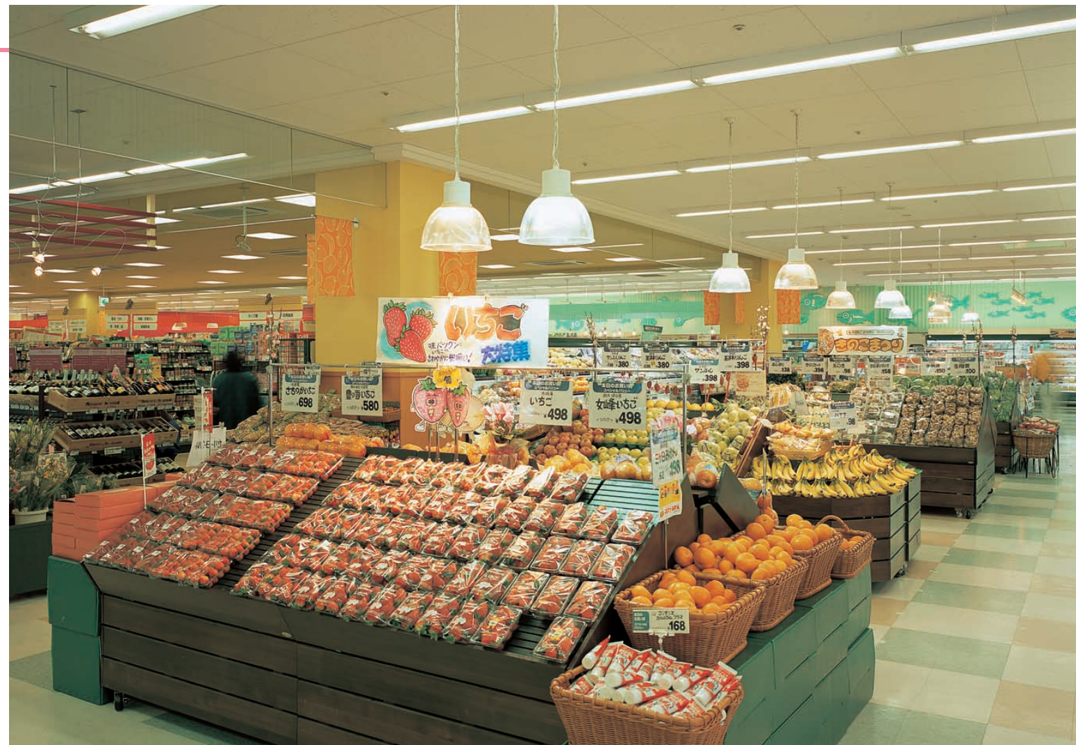
青果コーナー Vegetable corner 高演色ナトリウムランプと高効率メタルハライドランプの混光照明で様々な色の青果を引き立てるとともに、青果のもつ明るくにぎやかな雰囲気をつくり出している。ベース照明は、HfユーラインS直付器具をSESLで適正照度制御を実施し省エネ化を実現している