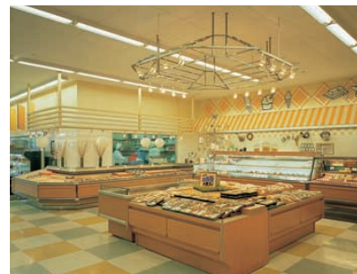
惣菜・冷蔵エリア Delicatessen and frozen food area 75Wネオハロビームスポットライトのクールな光で鮮やかに商品を照射している