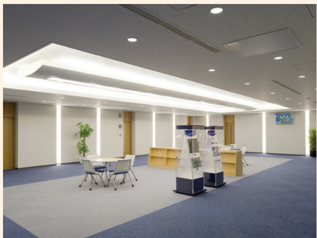
▲3階ホール 3階は研修室で形成されるフロア。既設器具107台が電球形LEDランプ(白色相当)に交換されました

●企業紹介:イビデン(株)は携帯電話のプリント配線板やパソコン向けICパッケージ基板といった電子部品関連、特殊炭素などのセラミック関連を主とする電気機器メーカーです。1912年に電力事業を行う会社として創業、現在は国内6事業場、世界15カ国に海外拠点を置く。SiC-DPF(炭化ケイ素製ディーゼル車黒煙除去フィルター)の生産では市場の約60%のシェアを占める。