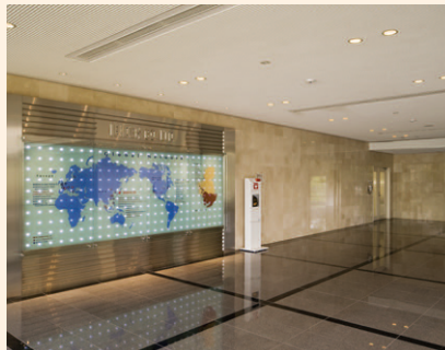
▲1階ホール 受付フロアの下がり天井部分には電球色相当の電球形LEDランプを50台交換