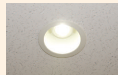
▲交換後のダウンライト 高出力LED電球(ミゼットレフ40ワット相当)に交換