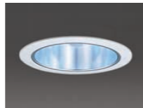
70W CDMランプダウンライト