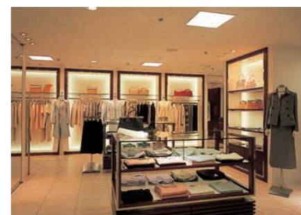
3階婦人服売場の照明