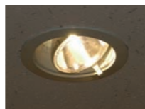
70W CDMランプユニバーサルダウンライト