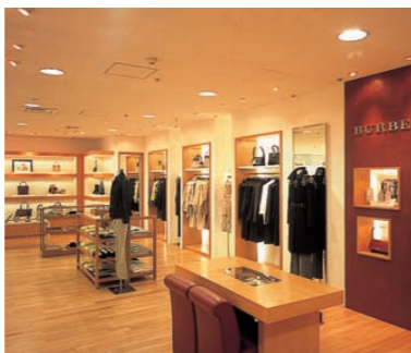
ベース照明はダウンライトで照度を低めに設定。壁面の間接照明とバランスのよい光環境を演出