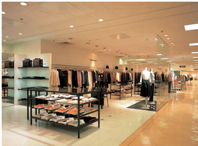
4階婦人服売場の照明：ショップごとに多様な照明手法が随所に取り入れられている

ショップ毎に多様な照明手法を取り入れた の照明リニューアルで、メリハリのある魅力 的なショッピング空間の創出 ベース照明の拡散光と高効率・高演色ラ ンプを組合せて商品の質感や色彩を美しく 引き立てる効果的な演出