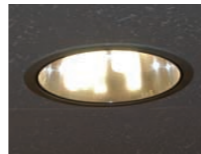
42Wコンパクト形蛍光ランプ3灯用ダウンライト