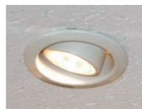
12V50Wハロゲンランプユニバーサルダウンライト