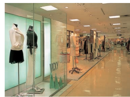
3階婦人服売場の照明：ディスプレイにはCDMランプを、陳列商品には熱線カットのハロゲンランプを採用