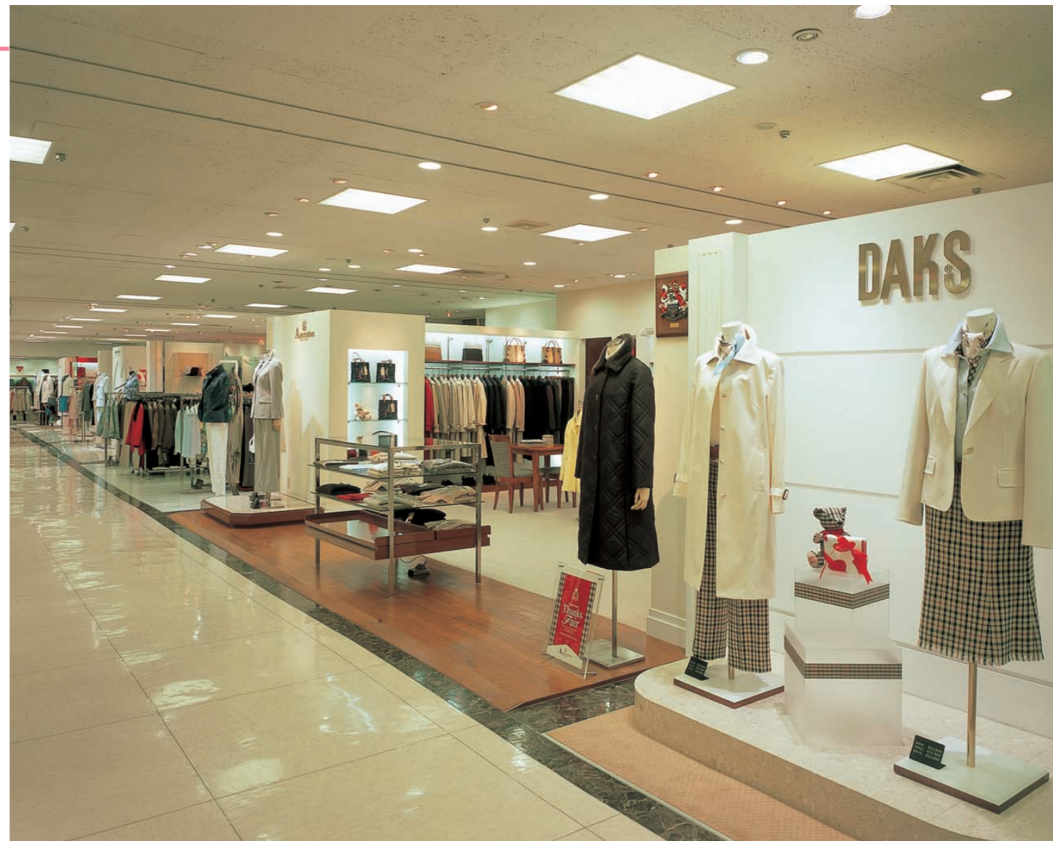
6階婦人服売場の照明：商品が鮮やかに美しく見えるようランプの色温度、ビーム角や器具の配置を細かく考慮