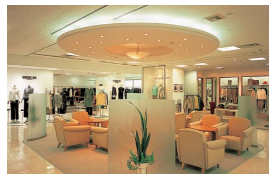
6階レストスペースの照明：間接照明の優しい光とダウンライトによりつるぎ感と安らぎ感のあるスペースを提供