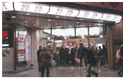
外観の豪華さに合わせてデザインされたコーナーブラケット：ランプは32WHf蛍光ランプを採用