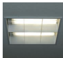
2～9階のベース照明：36Wコンパクト形蛍光灯4灯用スクエア器具