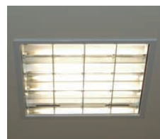
1階のベース照明に採用された55Wコンパクト形蛍光灯4灯用スクエア器具