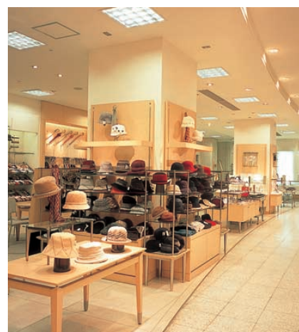
1階帽子・アクセサリー売場の照明