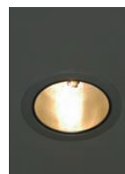
150W CDMランプダウンライト

高効率・長寿命の照明器具と配置の統一化で、洗練されたライフスタイルを提案する商品イメージとの調和を図った照明リニューアル。照度アップを図りながらレイアウト変更にも容易な対応