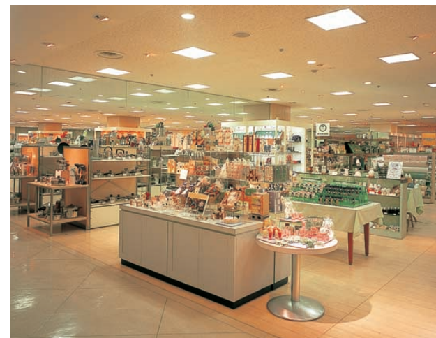
6階家庭用品売場の照明