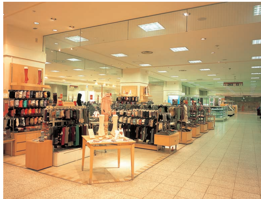
1階フロア：メイン通路を中心に55Wコンパクト形蛍光灯4灯用スクエア器具をシンメトリックに配置。明るくすっきりとした光空間を演出

インナーガーデン(天井高5m)は、高効率なCDMランプを光源としたダウンライト照明により開放感を演出するとともに、ランプの色温度を3000Kとして1階売場空間との連続性に配慮。さらにガラス壁からの漏れ光と壁面側に配置したハロゲンランプの輝きにより、外の通行者への誘導性を高めています。