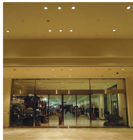
インナーガーデンの照明：ダウンライトにより開放感を演出