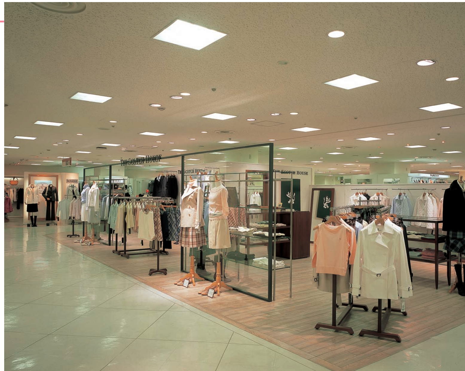
2階婦人服売場の照明：ベース照明に36Wコンパクト形蛍光灯4灯用スクエア器具を採用