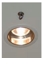
70W CDMランプダウンライト