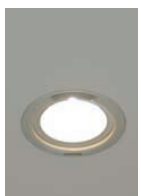
100Wハロゲンランプダウンライト