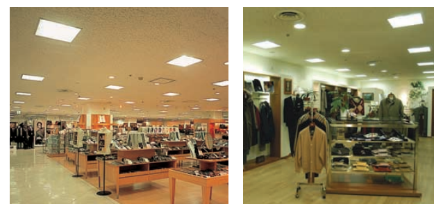
7階紳士服・紳士服飾雑貨売場の照明