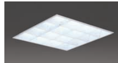
105WHfコンパクト形蛍光ランプ4灯用スクエア器具