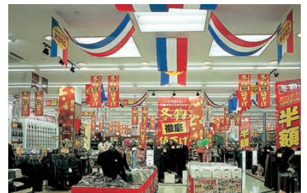
季節商品が陳列される入口周辺の照明