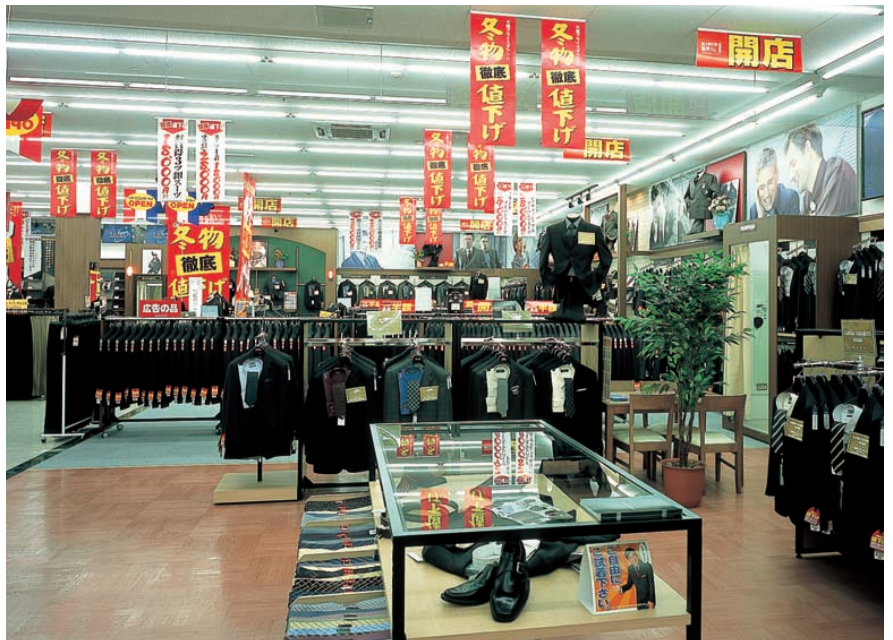
ベース照明に105WHfコンパクト形蛍光ランプ1灯用逆富士形器具を採用。明るい視環境を確保しながら省エネを実現

省エネ重視、明るさ重視とし、省エネと明るさのバランスのよい照明器具の選定。明るい視環境を創りながらライフサイクルコストの低減