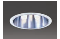
42Wコンパクト形蛍光ランプ3灯用ダウンライト