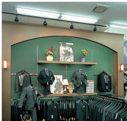
ディスプレイや重点商品には85Wハロゲンランプスポットライトにより演出効果を高めている