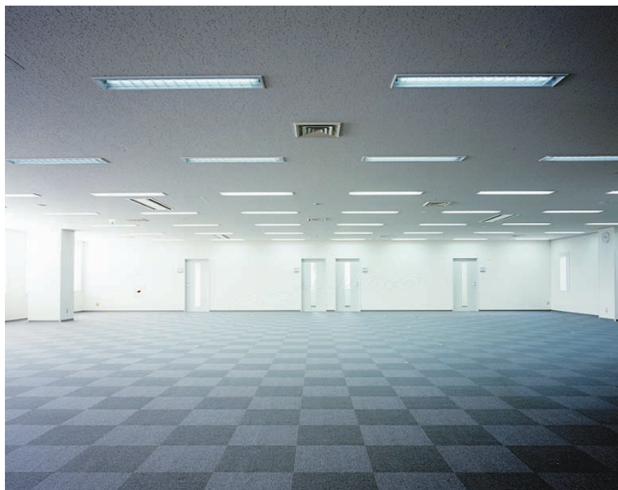
執務室の照明：32WHf蛍光ランプ2灯用埋込器具と照度センサを設置し、机上面照度750lxに自動調整。夜間は650lxに減光