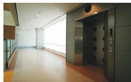
廊下の照明：照度センサにより昼光利用制御を行い、人感センサにより不在時の5%減光を実施