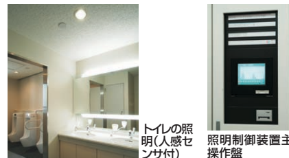
トイレの照明(人感センサ付)