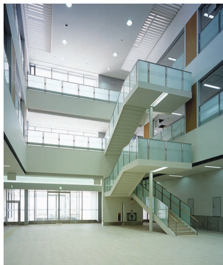
吹抜けエントランスホールの照明：昼間は積極的に昼光を取り入れ、明るく開放的な空間を創出