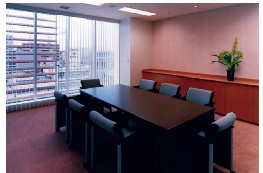
照明が設置された部屋の内観