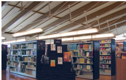
図書館の照明：手前から奥を望む