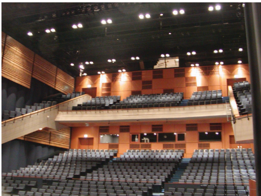
文化ホールの照明：250Wハロゲンランプダウンライト2台を1セットにして配置