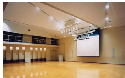
多目的ホールの照明：建築意匠に合わせて交互にV形配置