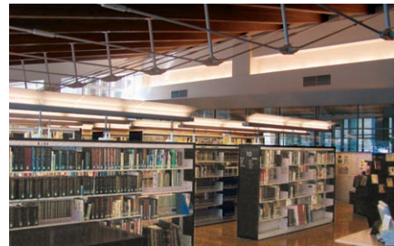
図書館の照明：奥から手前を望む