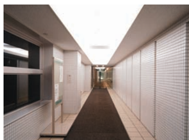
駐車場から地下2階出入口につながる通路の照明