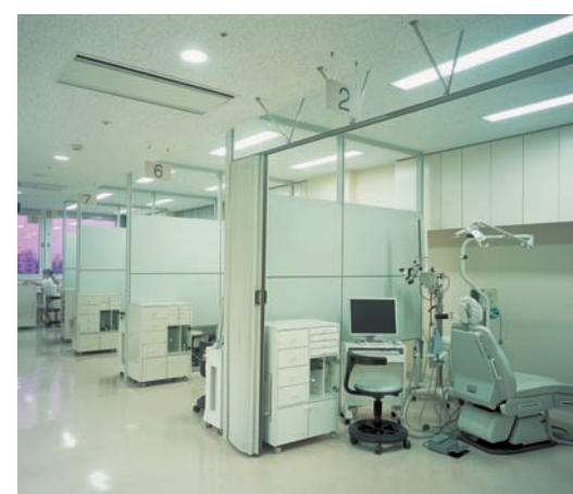
歯科口腔外科診察室の照明：各診察室に32WHf蛍光灯ランプ2灯用乳白カバー付埋込器具2台を、通路にはダウンライトを配置