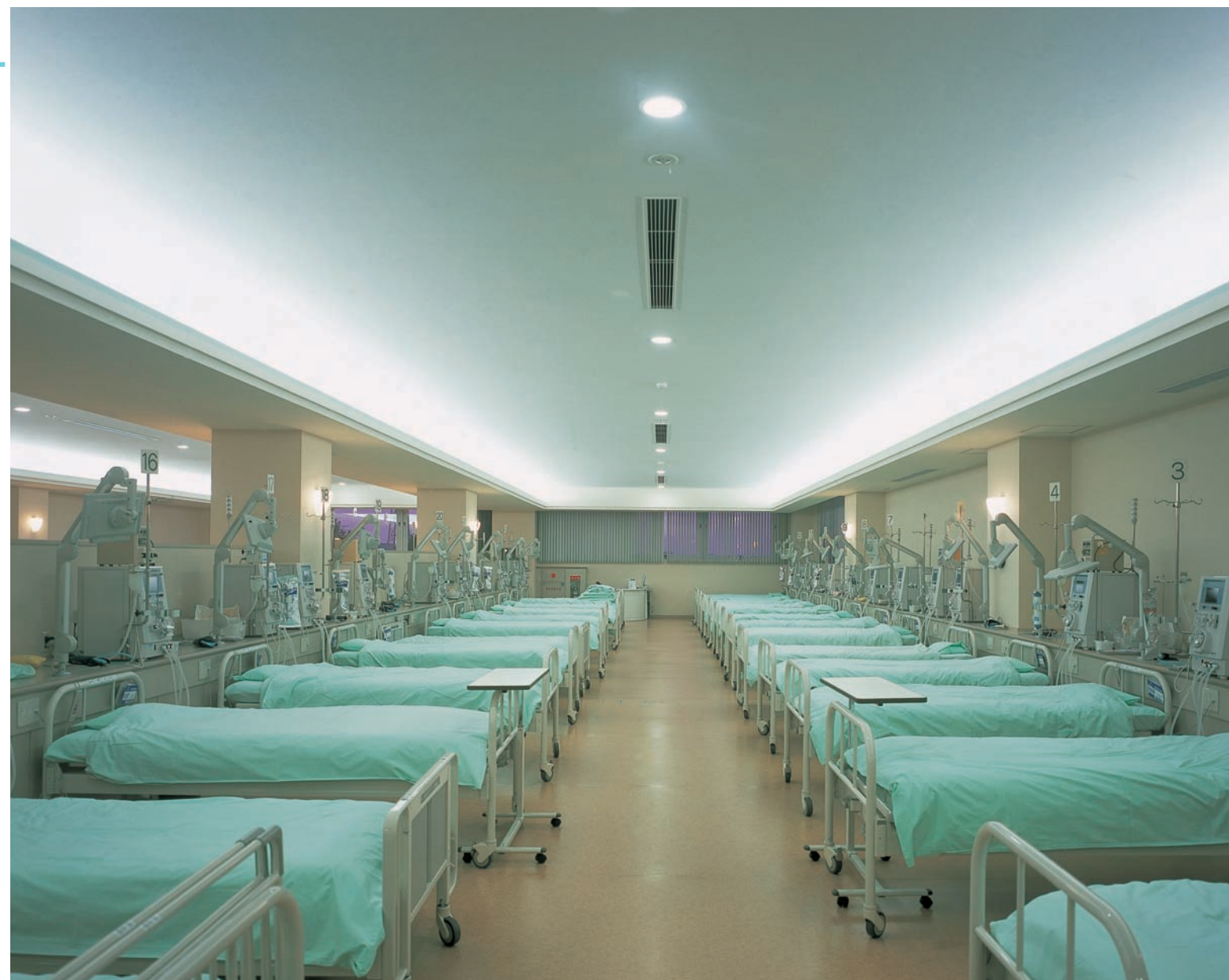
透析室ベッド周辺の照明：間接照明とブラケットを採用し、眩しさを軽減しながらソフトなイメージを演出。ベッド足元側通路にダウンライトを設置している