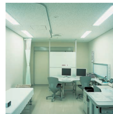
外来外科診察室の照明：32WHf蛍光灯ランプ2灯用乳白カバー付埋込器具を4台設置