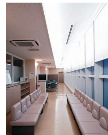
診察室外待合室の照明