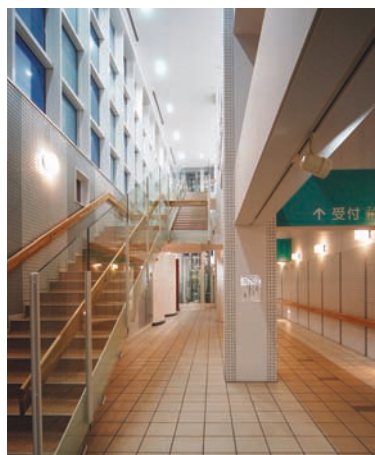
吹抜け天井及びエントランスホールの照明