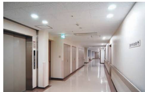
職員通路の照明：入口周辺上部にダウンライトを2台ずつパランスよく配置