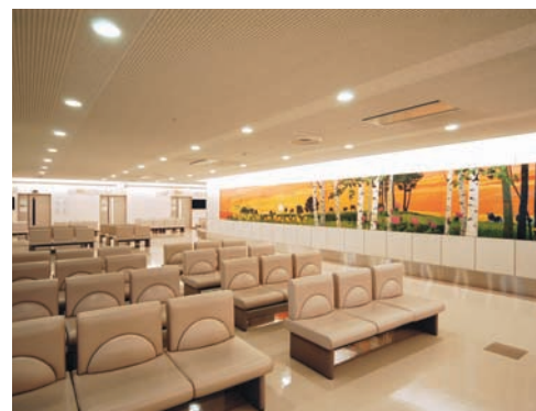
待合ホール待合スペースの照明：27Wコンパクト形蛍光灯ランプダウンライトと間接照明で落ち着きと安らぎ感を創出