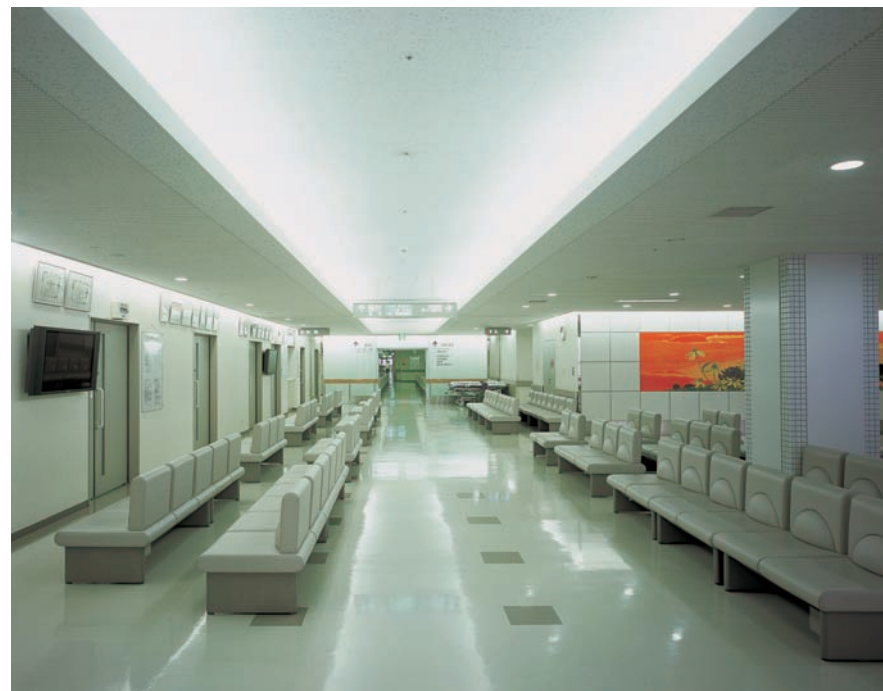
待合ホール通路の照明：直線的な折り上げ天井と間接照明のさわやかな光で空間の広がり感と誘導性を高めている