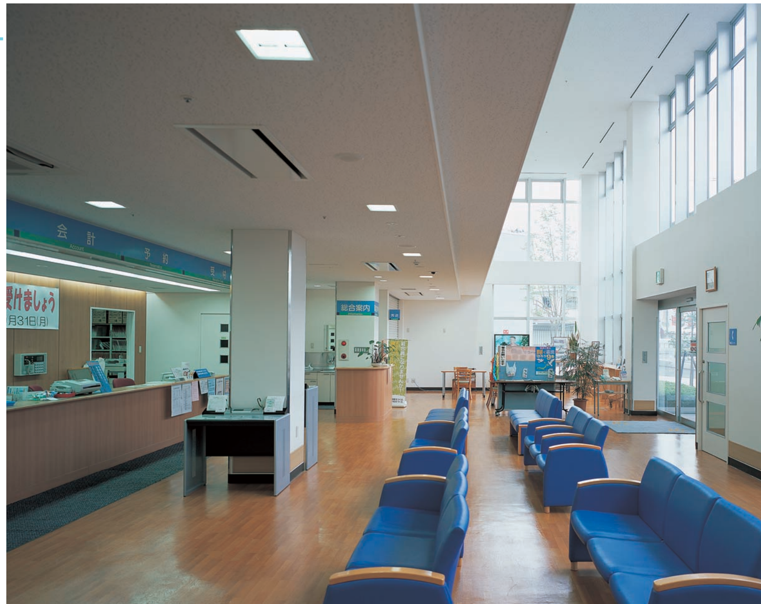
1階総合受付・待合ホールの照明：ルーバ付スクエア埋込器具(FML36W×2)と壁面には間接照明を採用