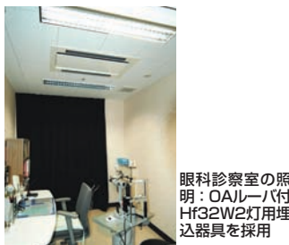
眼科診察室の照明：OAルーバ付Hf32W2灯用埋込器具を採用