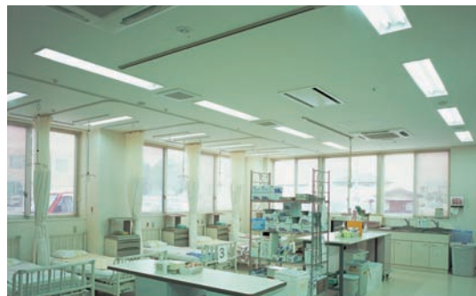
中央治療室の照明：Hf32W2灯用埋込器具の他、各ベッド上にはブルスイッチ付Hf32W1灯用埋込器具を設置