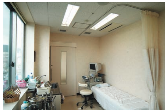
外科診察処置室の照明：25～100%の調光可能