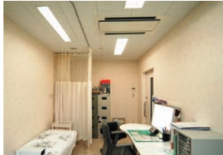
外科診察室の照明