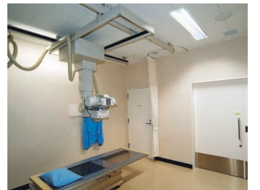
検査室の照明：OAルーバ付Hf32W2灯用埋込器具を採用