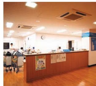
ナースステーションの照明