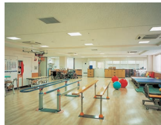
リハビリテーション室の照明：折り上げ天井にアルミルーバ付スクエア器具(FHP32W×4)を整列配置、楽しみながらリハビリが行える光環境を形成