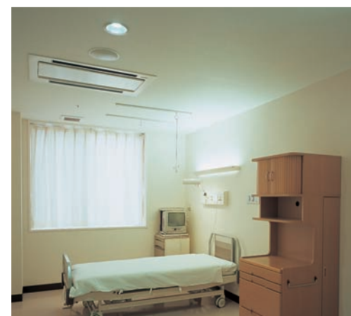
病室の照明：ベッド周りをスッキリとさせるメディカルコンソールを設置