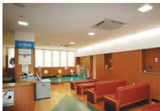
プレイルームを配置した小児科待合室の照明