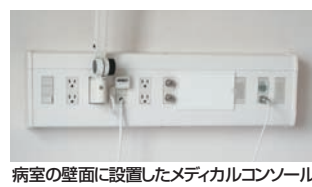
病室の壁面に設置したメディカルコンソール