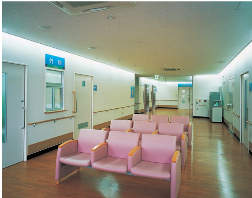
2階診察待合室の照明：両壁面に間接照明を施し、緊張感を取り除く優しい印象の空間を形成