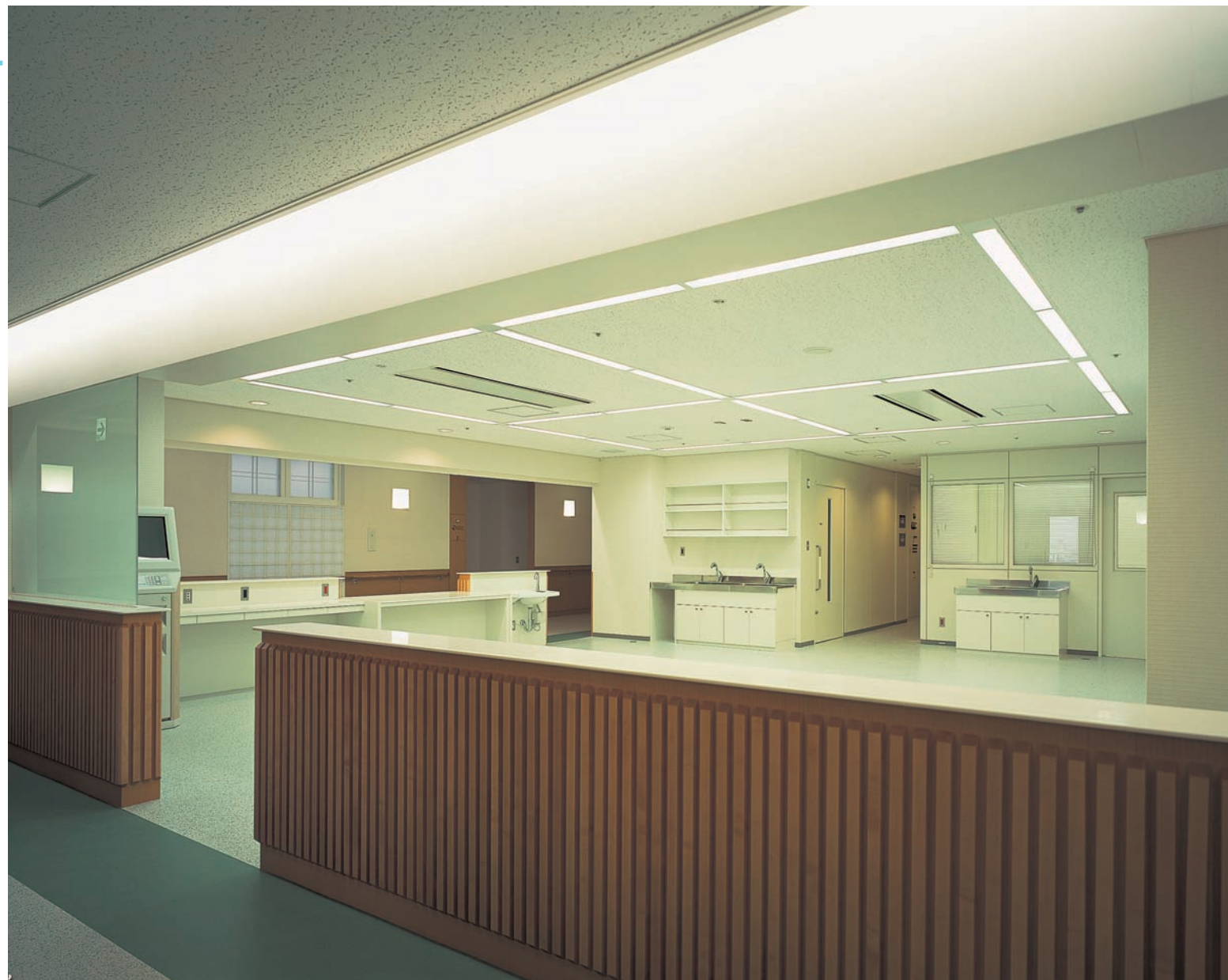
ワークステーションの照明:Hf1灯用埋込器具ルーバ付を田の字配置。カウンタ上にはダウンライト、廊下側は間接照明。スタッフの働きやすさと患者とのコミュニケーションのしやすさを配慮