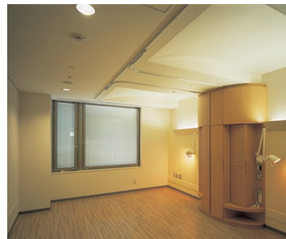
病室の照明：アッパーライトで折り上げ天井を照らし、各ベッド毎に光のパーソナルスペースを形成