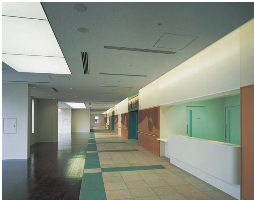
外来外待合は光膜天井として天窓に近い雰囲気を作り出し、廊下は壁面上部の間接照明により誘導性を高めている