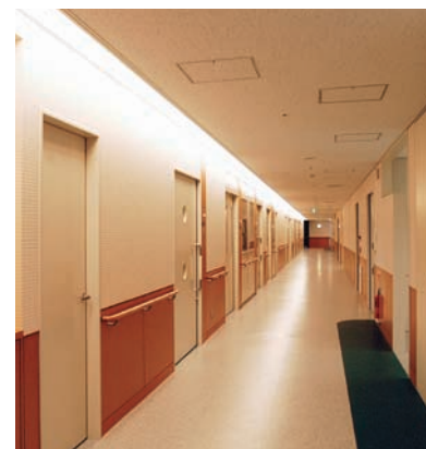
病棟廊下の照明：廊下の片側に間接照明が施されている