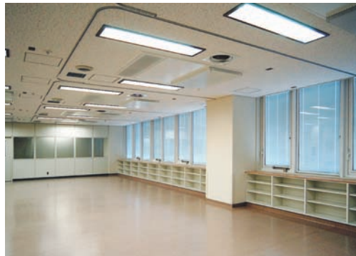
埋込形クリーンルーム用器具を採用したICU・CCU