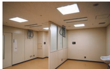
歯科口腔外科の照明(乳白カバー付スクエア器具)