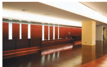
間接照明主体の総合受付・待合ホール