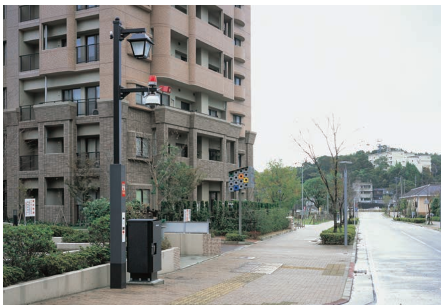
北九州市八幡東区高見地区団地周辺に設置されたスーパー防犯灯

北九州市八幡東区に5基設置されたスーパー防犯灯は高さ約5mで、地上から約1mのところに通報装置が設置され、警察署に置かれた受付装置と専用の電話回線でつながっています。TVインターフォン機能により、通報装置の通報ボタンを押すと、警察署と直接話すことができる仕組みで、通報と同時にポール上部のブザー、赤色灯、防犯カメラが作動して周囲の状況を映し出した映像を署内の受付装置に伝送します。これにより、災害・犯罪発生の早期発見や被害拡大の防止、またスーパー防犯灯の存在自体が地域社会の犯罪抑止に貢献するものと期待されています。