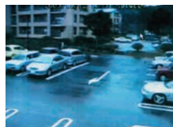
防犯カメラ映像表示例