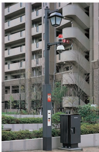
スーパー防犯灯(取付柱及び通報装置)