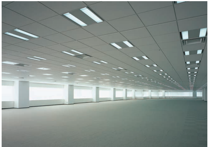
基準階オフィスフロアの照明：グリッド形システム天井を採用し、照明は24Wスリム形蛍光ランプ2灯用埋込器具（遮光ルーバ付）をワングリッドに2台設置

照明器具は24Wスリム形蛍光ランプ2灯用埋込器具（バツフル付）をワングリッド内に2台採用し、照明器具の両側には空調リターン用スリットを設け、中央部は煙感知器・スピーカなどの設備スペースに使用しています。蛍光ランプは色温度5000kの活動的な昼白色を使用し、机上面平均照度は850lxを確保しています。また、グレア対策として器具下面に遮光ルーバを採用し、VDT作業に対しても目の疲労を少なくした、長時間の執務に耐え得る快適な照明環境を実現しています。