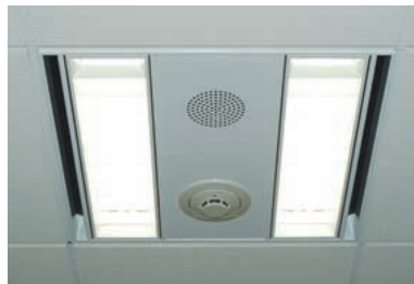
グリッド照明器具。器具中央は設備プレート