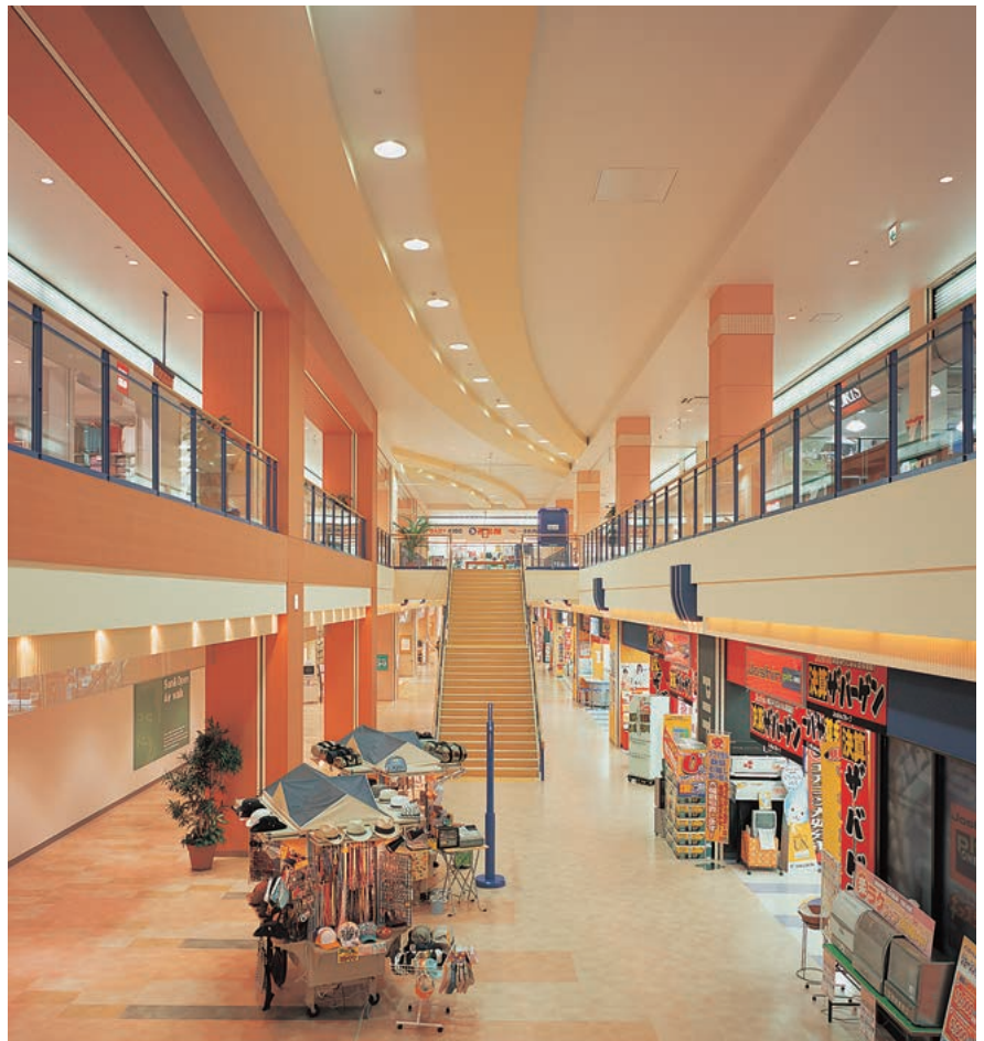
1階吹き抜けモール(ワゴンショップ)の照明：弧を描くように配列した400Wメタルハライドランプ(昇降装置付)ダウンライト

建物外部は、150Wセラミックメタルハライドランプ投光器を中心に、カラフルな建築意匠や照明付サインを引き立てるよう、ポイントを絞ったスポット的な照明演出を行い、建物内部から漏れる光とともに、賑やかに華やかに、カジュアルな夜の景観を演出しています。