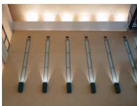
壁面に設けられた150Wセラミックメタルハライドランプ投光器