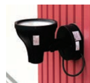
壁面上部を照射している150Wセラミックメタルハライドランプ投光器