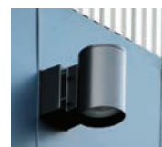
車の出入口上部に設けられている400WHID投光器