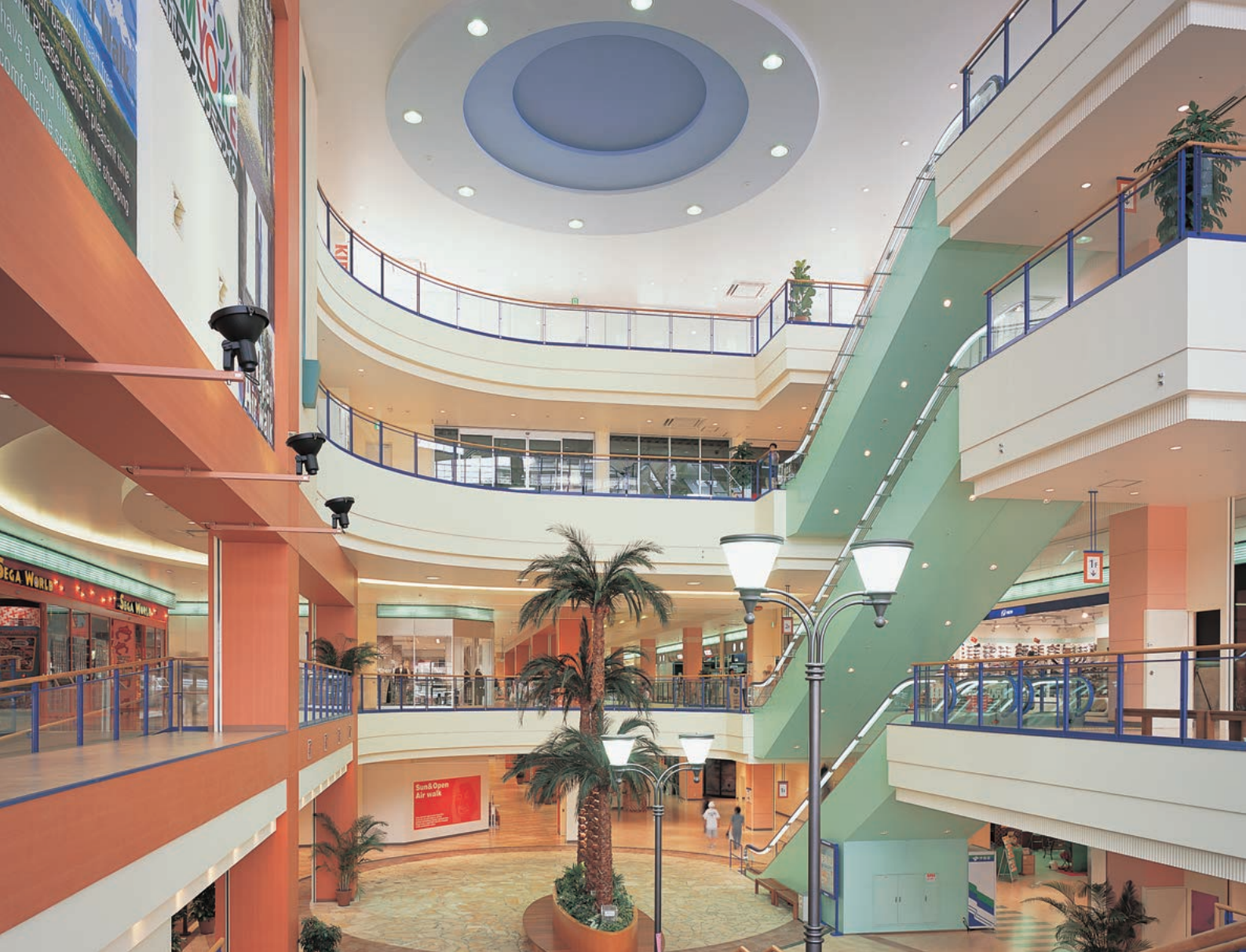
イベント広場の照明：吹き抜け部に400Wメタルハライドランプ(昇降装置付)ダウンライトを配置。大階段にはアウトドア感を高める街路灯を設置している