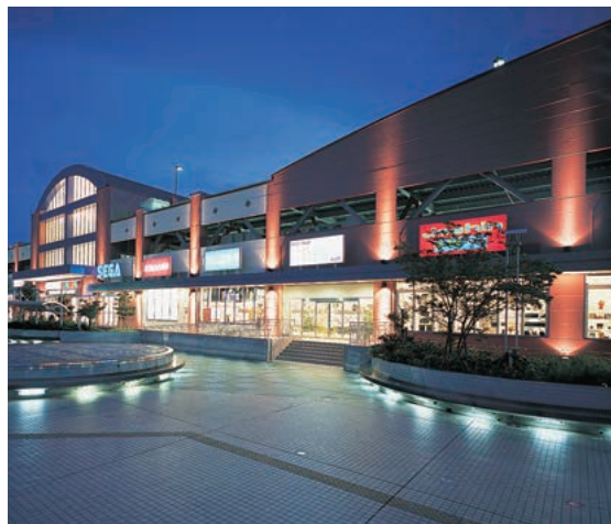
建物外部のライトアップ：150Wセラミックメタルハライドランプ投光器を中心にカラフルな建築意匠を引き立てている