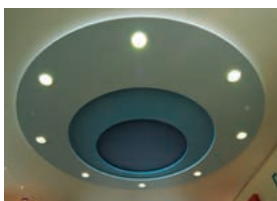
吹き抜け天井に円形状に配置したダウンライト(MF400W)