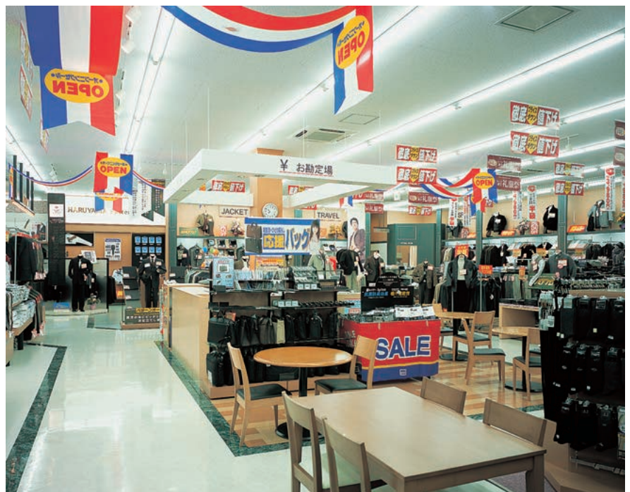
売場内の照明①：105WHfコンパクト形蛍光灯2灯用薄型直付器具を配置

入口部の照明は、開放的で安心感が得られるようにすると共に、季節商品も展示されるため、ベース照明に105WHfコンパクト形蛍光灯4灯用埋込器具(バップル付)を5台設置し、その周囲に42Wコンパクト形蛍光灯3灯用ダウンライトを配置。重点商品には85Wネオハロクールスポットライトの照射方向自在形を使用して質感、光沢感の表現を効果的に演出し、購買意欲を盛り上げています。