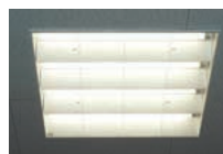
105WHfコンパクト形蛍光灯4灯用埋込器具