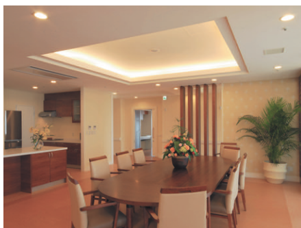
共同で食事や憩いの場として利用するリビング・ダイニング。介護居室と連なる