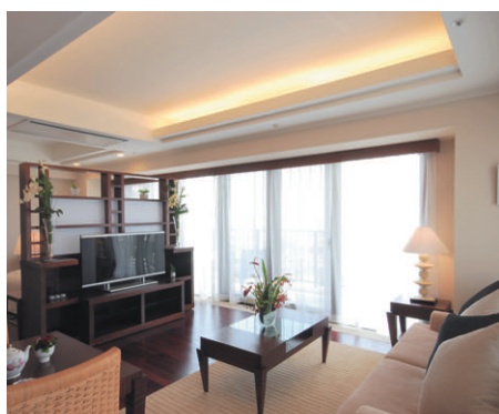
占有面積が60㎡の一般居室。約4.7m×4.5mの折り上げ天井部分に直付トラフを長手方向に3台配し、天井面と一体化した照明手法を採り入れている