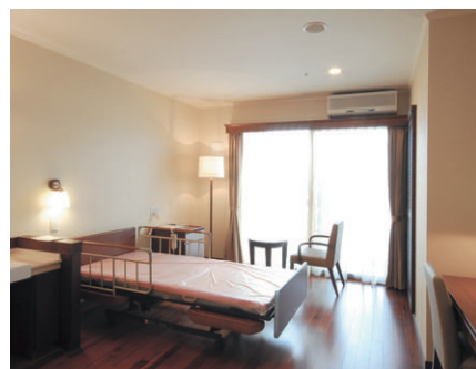
全個室で家具付きとなる介護棟の居室。車椅子での移動に配慮し、ゆったりとした空間になっている