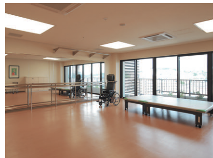
リハビリ室ではHfユーラインFHP105W×4灯スクエア器具を採用して、高照度な明るさを確保する