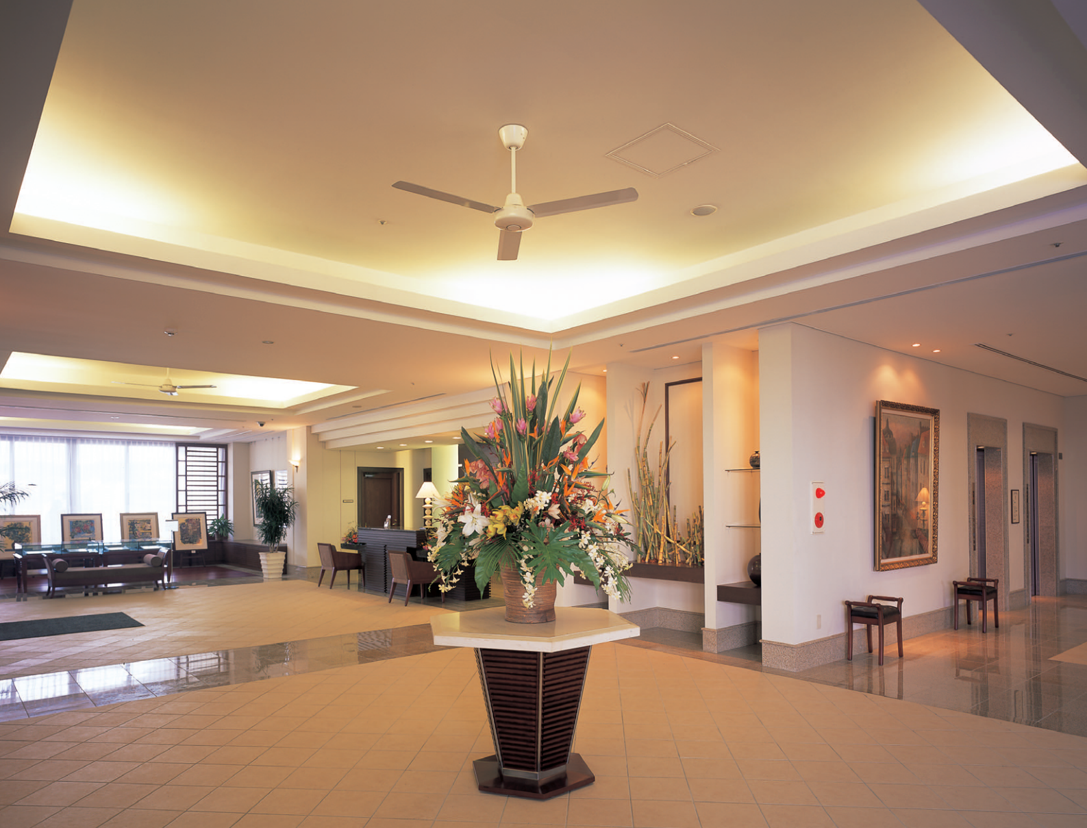
コンシェルジュサービスを備えたリゾートホテル風のエントランス。白垂の天井と一体化した建築化照明手法が当施設の特徴