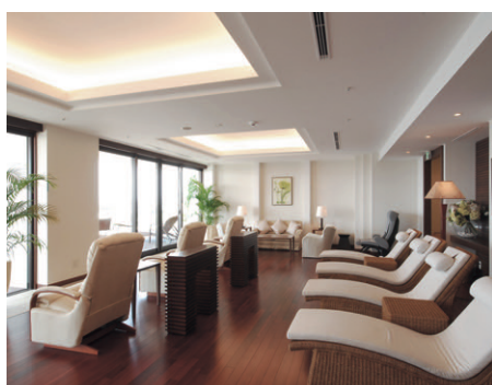
スパ(大浴場)を利用した後にくつろぎの場となるリラククスラウンジ