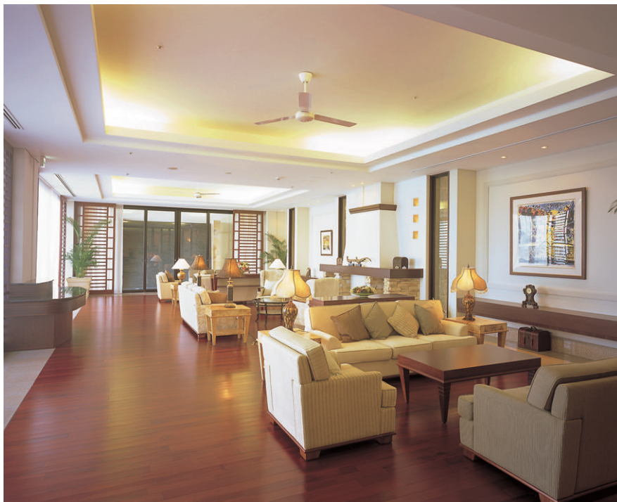
沖縄の海を眺望できるロビーラウンジ。さりげなく調度品や涼しげなヤシが置かれている

一般居室棟の付帯施設には、スパをはじめ、ライブラリー、フィットネスルーム、プール、多目的ホール、茶室、シアタールームほか、豪華で充実したアメニティを配置しており、当施設のコンセプトである「心豊かに」と「癒し」を反映させた照明演出が一般的になされています。