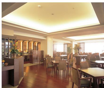
バーカウンターを付設したレストラン全景。奥側にはプライベートダイニングがある