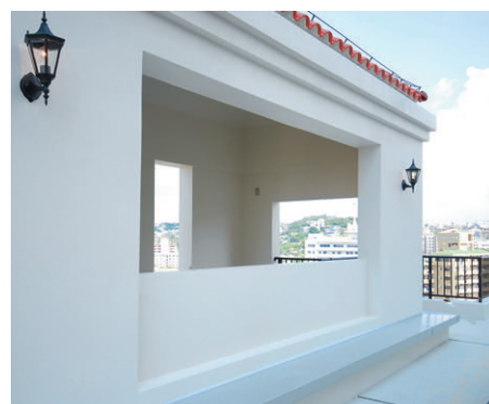
4階の共用フロアにある避難階段。沖縄の瓦屋根とアメリカンスパニッシュが融合した建築様式と調和する洋風ブラケット