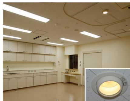
中央処置室の照明 診察室と同様器具に加え、照射可変形の処置灯を設置