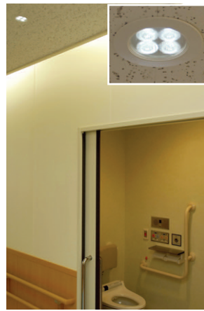
病棟廊下沿いのトイレ常夜灯 LEDダウンライト(5.3W)をトイレ前の廊下の天井に設置