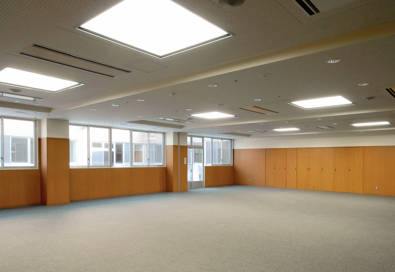
病院棟2階研修室の照明 折り上げ天井には105Wコンパクト形蛍光ランプ4灯用埋込器具(カバー付)を設置し、蛍光灯ダウンライトで補光。自然光風に開放感を高めた光環境を形成