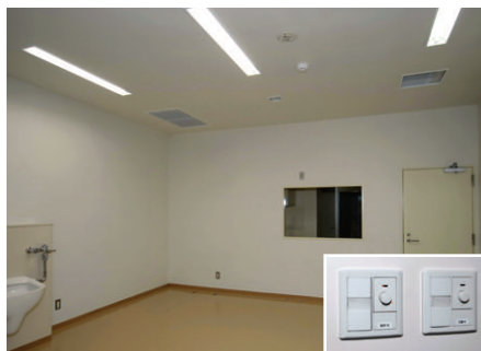
X線TV室の照明 32WHf蛍光灯1灯用埋込器具調光形を採用。小形調光器(コントロールクス)にて5~100%連続調光