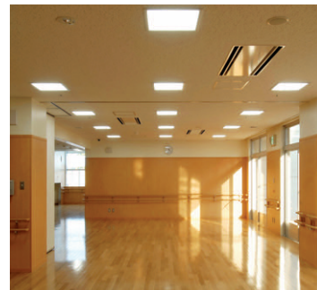
訓練施設棟の照明 32Wコンパクト形蛍光ランプ3灯用スクエア器具を設置