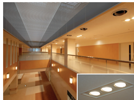
病院棟メイン通路の照明 2階通路の天井にLED埋込ダウンライトを配置し、1階通路を照明