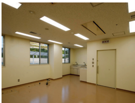
病院棟診察室(歯科)の照明 32WHf蛍光灯2灯用埋込器具下面カバー付で拡散光の柔らかな光環境を形成