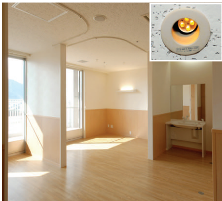
病棟病室の照明 ベースライト、ベッド灯のほか、入口近くの天井にはLEDダウンライト(0.9W)の常夜灯を配置