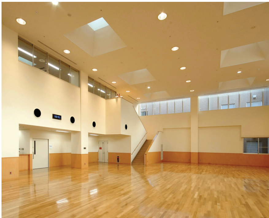
病院棟の理学療法室の照明 明るい吹抜け空間に適切な照度の確保と外光との光色バランスを考慮して250W高効率メタルハライドランプダウンライト(電動昇降装置付)を設置

また、全館に自動点検防災照明システムを導入し、誘導灯及び非常灯器具のランプ切れ、電池充電状態チェック、異常の有無、定期点検など、安全、確実に点検管理が行われています。