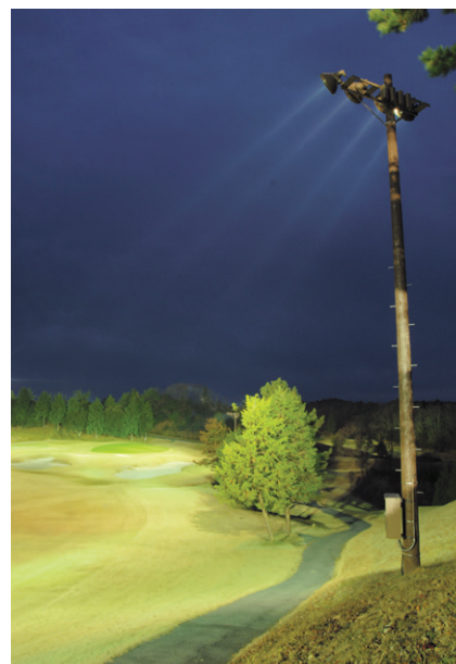
バランスの良い配光角度に設定して、ラフ部分までも広範囲に照らし出す