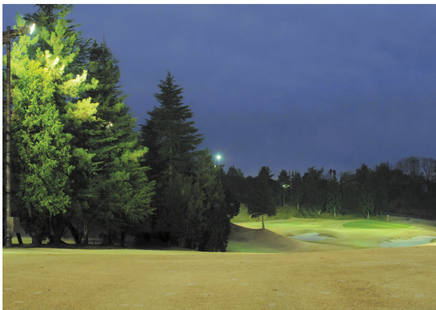
自然の地形を利用した緩やかなアンジュレーションの6番ロングホールフェアウエイ中央付近。ボール位置の確認はもちろん、打ち出しのボールの軌跡を視認できるほどの照度を確保している

夕闇上空に放たれ弧を描いた白いボールと、自然あふれる緑濃いホールとが鮮やかに照らされ、爽快なラウンドを楽しむことができる人気のゴルフコースとなっています。