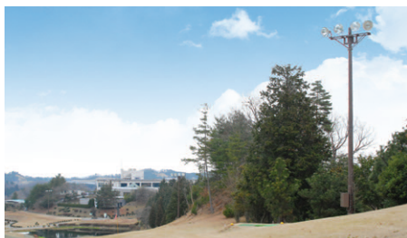
器具高さを14.0mに設定して、このロングホール6番にはメタルハライドランプ1kW投光器4灯付投光器を計8基設置