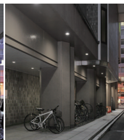
LEDダウンライト100Wタイプ採用の軒下照明