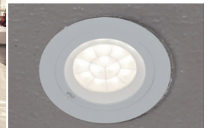
LEDダウンライト100Wタイプ