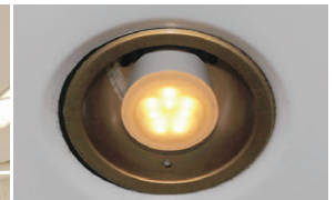
LED電球ミゼットレフ形60Wタイプ