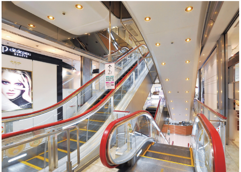
1Fエスカレータの照明 電球形蛍光ランプから[イー・コア]LED電球ミゼットレフ形60Wタイプに更新

また、貸多目的ホールに、蛍光灯スクエア器具と蛍光灯ダウンライトによる照明が施されていましたが、このうち蛍光灯ダウンライトをLEDダウンライト[イー・コア]100Wタイプ調光用に更新し、省エネ・CO 2 削減を図っています。