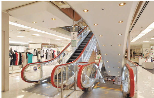
LED電球ミゼットレフ形60Wタイプに更新された2階エスカレータ