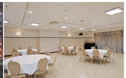
LEDダウンライト100Wタイプに更新された貸多目的ホール