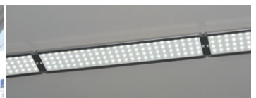
更新されたLEDベースライトストレートタイプ(連結設置)