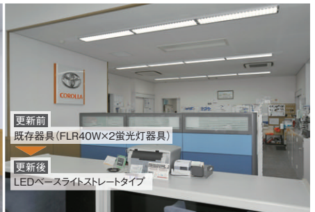
更新前 既存器具(FLR40W2蛍光灯器具) 更新後 LEDベースライトストレートタイプ