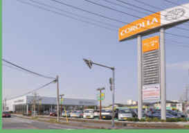
●トヨタカローラ千葉・八幡店 所在地：千葉県市原市 建築構造：鉄骨造平屋建 電気工事更新施工：式田建設工業（株） 電気工事更新完成：平成22年3月