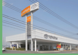
●トヨタカローラ千葉・館山店 所在地：千葉県館山市 建築構造：鉄骨造平屋建 電気工事更新施工：式田建設工業（株） 電気工事更新完成：平成22年3月