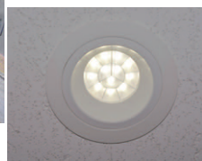
更新されたLEDダウンライト900シリーズ