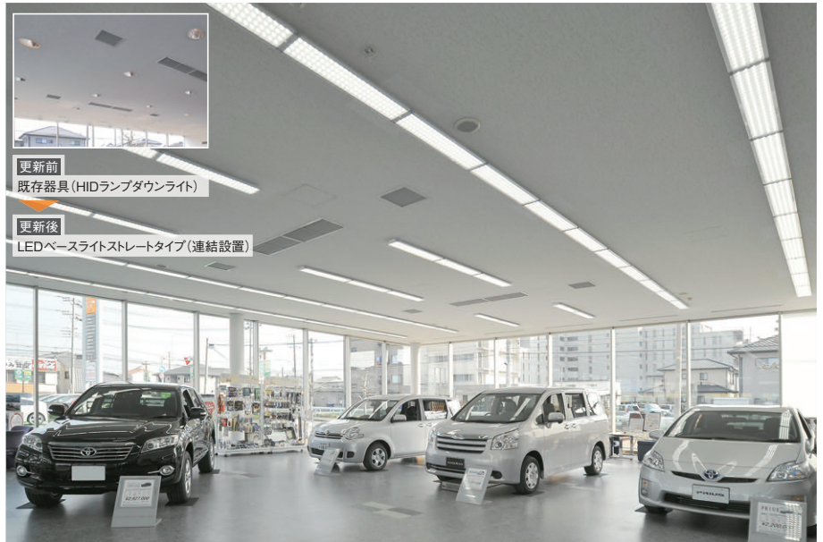
八幡店:HIDランプダウンライトからLEDベースライトストレートタイプ(連結設置)に更新したショールーム 展示車を魅力的に演出する適切な明るさを確保しつつ大幅な省エネ・CO 2 排出量の削減を実現

フロント事務室はFLR40W2灯用埋込器具の連結配置からLEDベースライトストレートタイプ(効率重視タイプ)に更新し、明るさをアップしながら約25%の省エネが図られています。