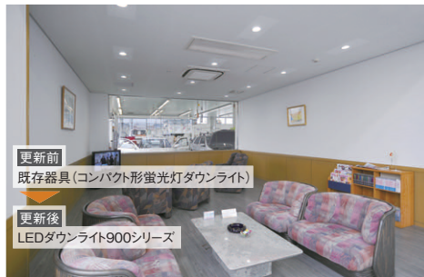
更新前 既存器具(コンパクト形蛍光灯ダウンライト) 更新後 LEDダウンライト900シリーズ