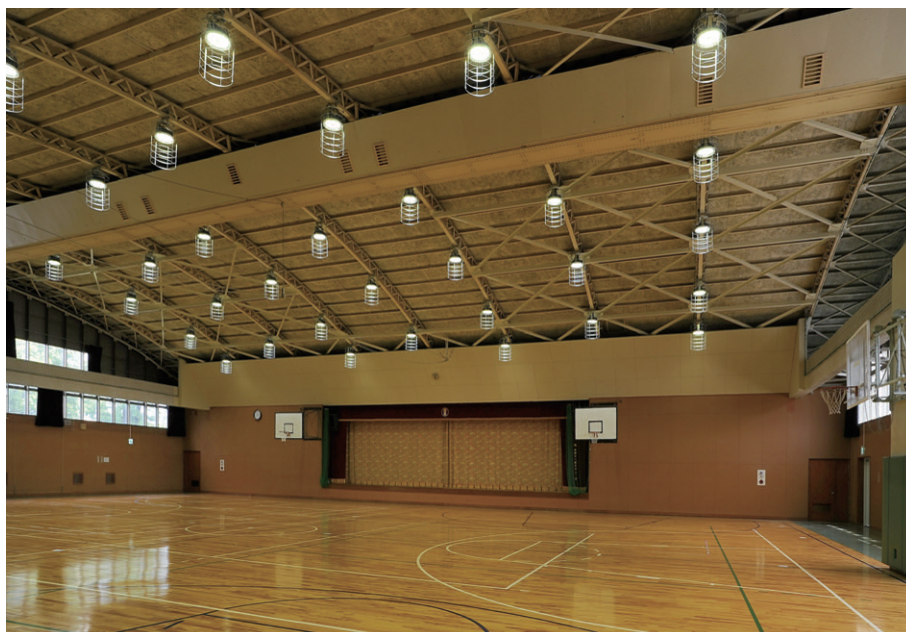
省エネ性能の優れたLED高天井器具に更新したアリーナの照明。点灯6パターンと調光パターンにより用途に応じた明かりを確保

また、競技種目に応じた明るさや利用スペースに準じたエリア別、あるいは舞台を使用する式典演出など、様々な用途に適切な照明環境が得られるようFLコントロールシステムを設け、エリアごと、または列ごとに点滅・調光(約5%~100%)を可能にしています。