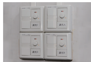
壁面に設置したFLコントロールシステム