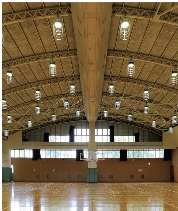
アリーナの側面から望むLED高天井器具。器具下面には高天井用ガードと体育館用ガードを装備