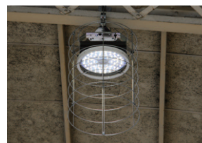
ガードを装備したLED高天井器具