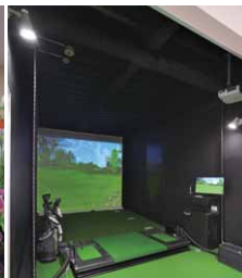
バーチャルゴルフコーナーにはLED小形スポットライトを採用