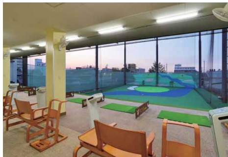
2階打席フロアの照明 打席後方に設けられた直管形LEDベースライト（高出力タイプ）