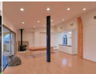
ゲストルームにはLEDユニットフラット形ダウンライトにより温かみのある空間が創出