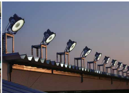
屋根上に等間隔で架台を設けて設置したLED投光器