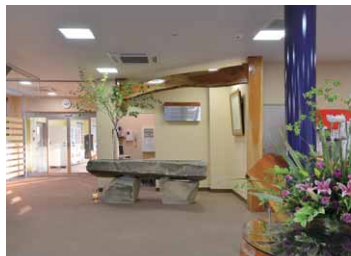
エントランスロビーには一体形LEDベースライトスクエア器具を配置