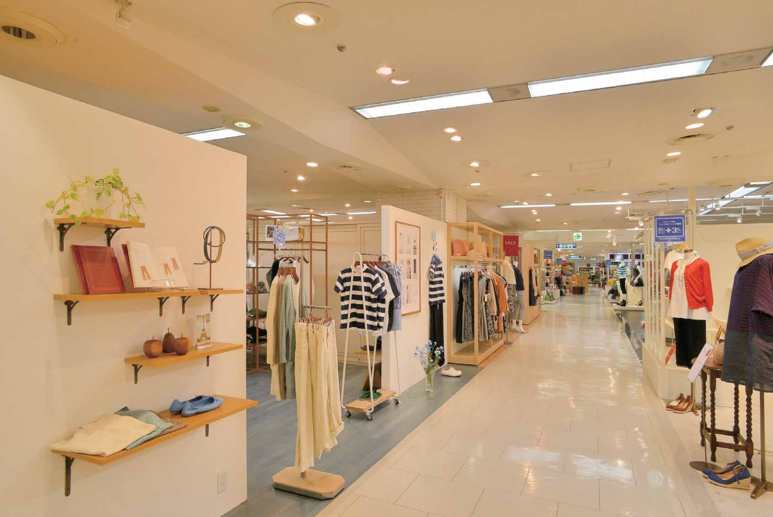
既存のCDM70Wハロゲン50W器具からLEDライトエンジンユニバーサルダウンライトに更新