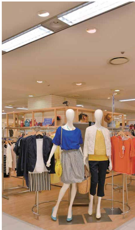
LEDライトエンジンユニバーサルダウンライトを重点照明に活用