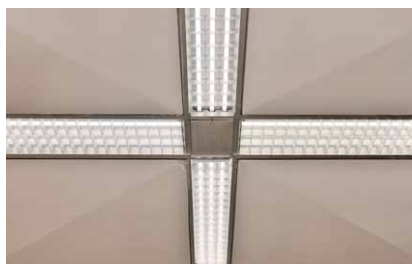
十字形配置のLED直管ランプ器具