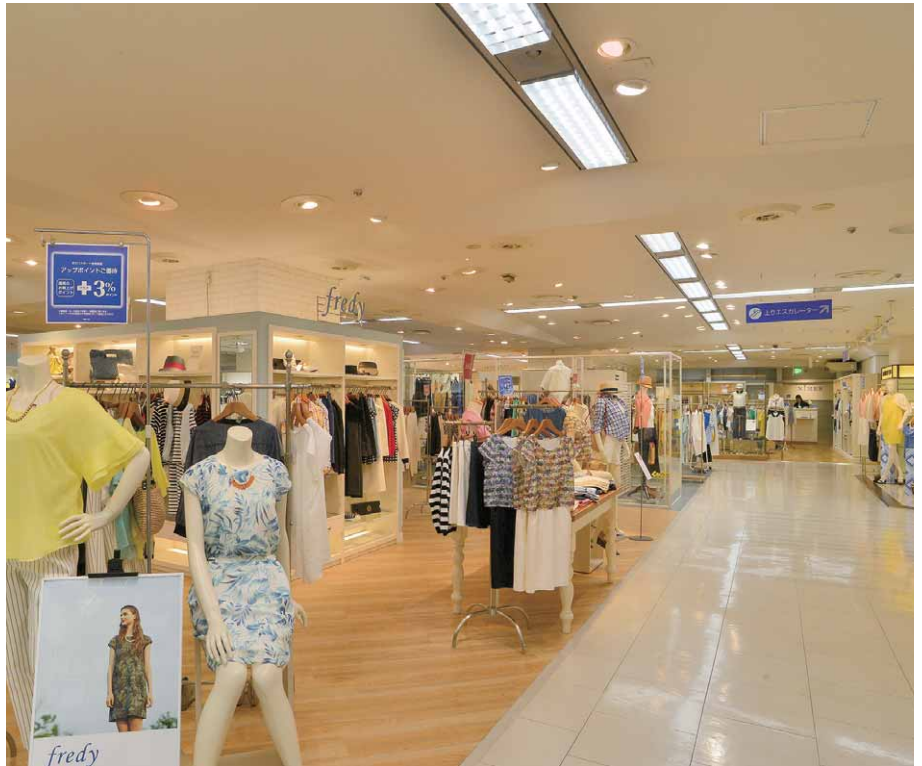
ベース照明は既存器具を活かしてLED直管ランプ3灯用に更新

2013年冬に行われた第二段階のリニューアルでは、ユニバーサルダウンライトの改修を実施。従来はφ150の50Wハロゲン器具・70WCDM器具が使用されており、既存開口径を利用したφ150LEDライトエンジンユニバーサルダウンライト（特注対応）へ更新。場所により、1100シリーズの色温度3000K（消費電力9.8W）と2000シリーズの色温度4000K（消費電力18.2W）を使い分け、温かみと明るさを両立した空間照明を実現しています。LEDライトエンジンへの更新により、既設比約79%という大幅な消費電力の削減を実現しました。さらに光源を交換できるため季節や商品などに応じて、配光、光色の変更も可能になりました。