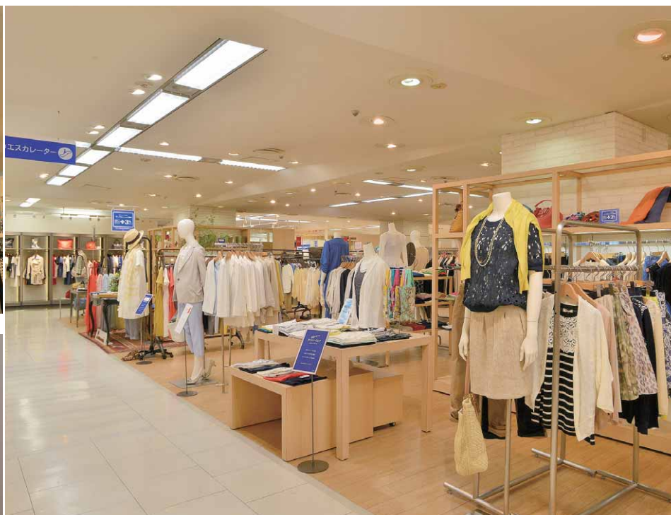
重点照明として商品を際立たせているLEDライトエンジンユニバーサルダウンライト