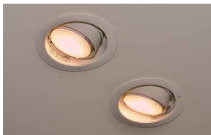
LEDライトエンジンユニバーサルダウンライト