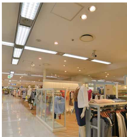
LED直管ランプ器具を十字形に配置