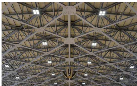
LED高天井器具に改修された天井面