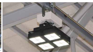
1kW形LED高天井器具の点灯時