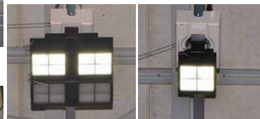
1kW形LED高天井器具の半点灯時 250W形LED高天井器具の点灯時