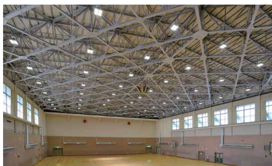
LED高天井器具に改修されたアリーナの奥側から正面側を望む

アリーナ(競技場)の既存の照明設備は、左右対称の均等配置によるメタルハライドランプ高天井器具の1kW×1灯用6台、400W×2灯用34台、400W×3灯用20台を設置していました。改修では優れた省エネ性能と60,000時間の光源寿命による作業困難な高天井でのメンテナンスコストの軽減化、加えて瞬時点灯・瞬時再点灯でこまめな節電が可能なLED高天井器具250W形6台と1kW形54台(いずれも器具用部品ガード+拡散カバー付および軽量用電動昇降装置付)により、既存と同じ台数を同一に設置。既存と同等以上の明るさを確保しながら消費電力63%の削減を可能にしています。さらに、初期照度補正機能搭載によりさらなる省エネ効果を発揮しています。また、点灯方式は、1/2点灯や列ごとの点灯ができるようにし、使用状況、競技種目に応じた点灯操作により無駄のない電力使用を可能にしています。