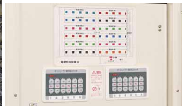
LED電動昇降装置用の操作盤