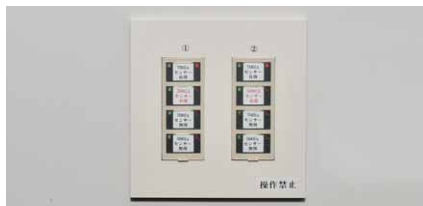
4つのシーン切り替えができる制御スイッチ