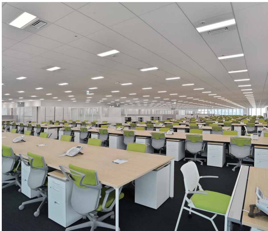
奥行き22.5mの広々とした無柱空間を実現したオフィスフロア全景 照明器具には特注1灯用LEDグリッドシステム天井器具を採用

このLED器具と照明制御システムによる省エネ効果としては、蛍光灯器具による従来方式と比較したシミュレーションの結果から、28~30%消費電力を少なく抑えられることが期待されています。