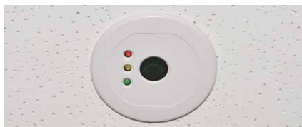
昼光利用制御ができる明るさセンサー