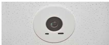
感知エリア7.2mのスマートアイセンサー