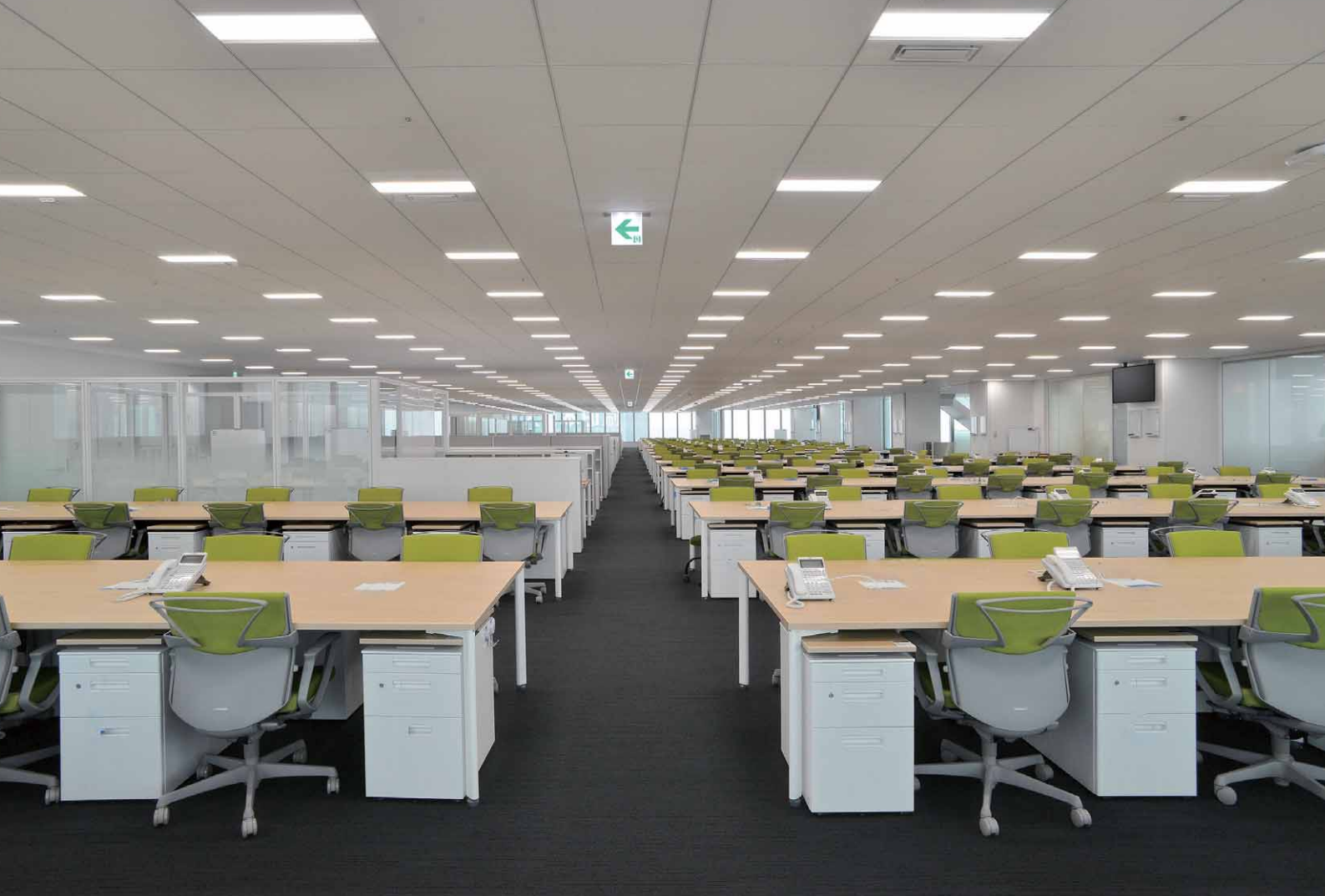
LEDグリッドシステム天井器具+スマートアイセンサー(人感センサー)+明るさセンサー(窓側設置)を採用した執務スペース全体を望む