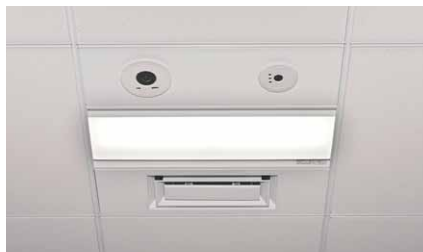
600mmグリッドサイズのLEDシステム天井器具