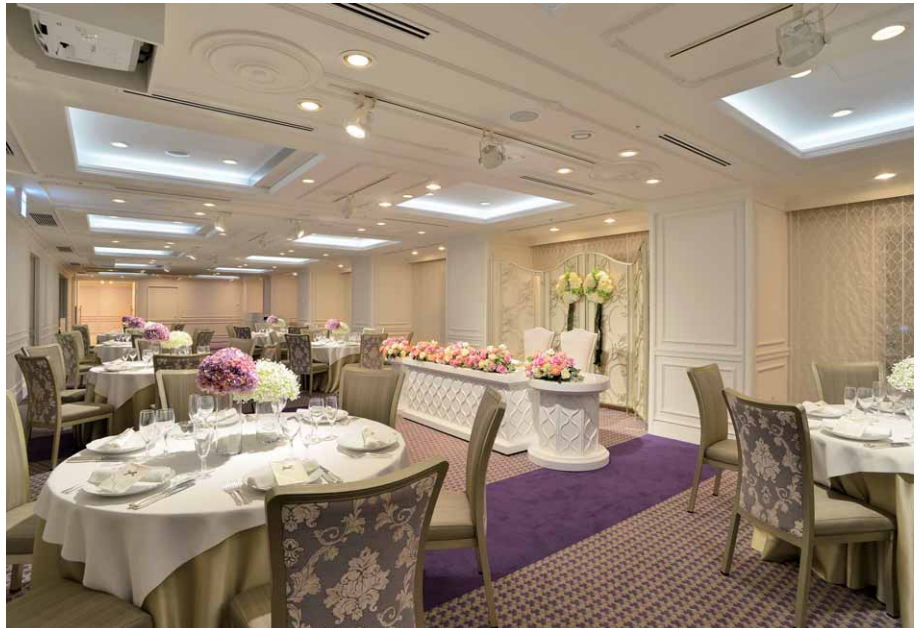
披露宴のセッティングがされたバンケット 白を基調としたエレガントな空間にLEDライトエンジンダウンライトとLEDライン器具のあかりが映える

披露宴の場となるバンケットは、約80名のゲストがどの席からも窓越しに眺望を楽しめる横長形態。内装のモールドイング装飾や調度類がシックな優美さを感じさせ、天井に整然と並ぶ四角く折り上げた建築化照明の昼白色の光が空間にアクセントを与えています。ベース照明には電球色のLEDライトエンジンダウンライトを採用。調光機能などを生かしたさまざまな照明設定が可能で、最大で1200ルクスを超える照度の光に満ちあふれた祝福の場をつくり出すことができます。