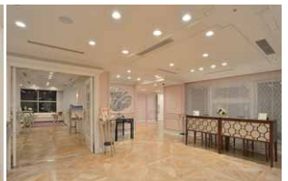
ゲストを迎え入れるホワイエ内受付