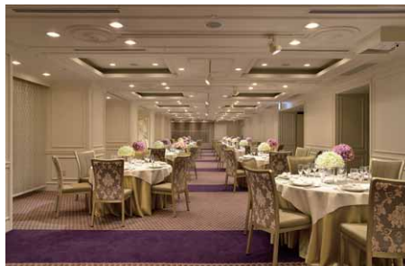
バンケット（LEDライトエンジンダウンライトのみ点灯時）