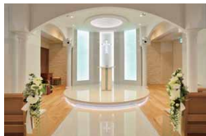
チャペル祭壇 昼白色の間接照明により華やかな空間を演出