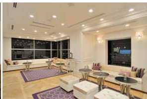
待合サロンはクラシカルな内装を引き立てつつゲストが落ち着けるあかり環境を創出