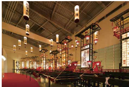
キリコ祭りで実際に使われている切子燈籠が所せましと並ぶ夕暮れの展示風景

キリコ展示スペースは、7mから9m高さの吹抜空間となっており、来館者は1階を觀賞した後、2階に上がってキリコを上から眺められるように空中回廊が設けられています。照明は吹き抜け空間において觀賞に適切なあかりを提供するため、LEDシーリングダウンライトを採用。安全性を十分確保したうえで、省エネ、省メンテを図りながら切子燈籠のライティングを損なうことのないように配慮し、展示スペースの天井に2列に配置して適度な間引き点灯により、ほんのり明るく照らす夕暮れの雰囲気を創出。同時に、キリコの搬入・搬出時には、LEDシーリングダウンライトを全点灯にして安全で快適な作業を可能にする十分な明るさが確保されています。