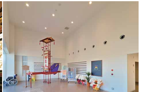
LEDユニバーサルダウンライトが設置されているエントランスホール