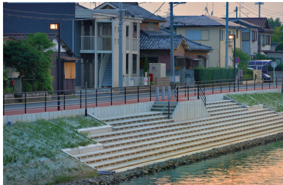
宮代町側の護岸整備とLED街路灯特注器具