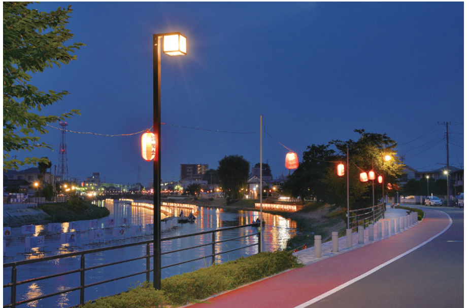
賑やかに浮かべた流灯をバックにして杉戸町側の遊歩道に設置したLED街路灯特注器具の点灯時

古利根川は約90mの川幅があり、今回、その護岸工事と遊歩道を整備。遊歩道の500mの区間においては、川を挟んで向き合うように50m間隔で地上5.5m高のLED街路灯特注器具一般ポールをそれぞれ6基、計12基が設置されました。従来の街路灯は蛍光灯を使用していたため、今回は大幅な節電とメンテナンスフリーなどを特徴とするLED街路灯(特注)を採用。街路灯の灯具は従来と同デザインの下方向を主体とした全方向拡散形配光の角型意匠で統一し一体感を図っています。同時に従来の蛍光灯街路灯は光源のみをLED電球に更新。新たに遊歩道としての親水空間が創出され、安全で、憩いの場、ゆとりの空間として親しみ感のある景観照明を演出しています。