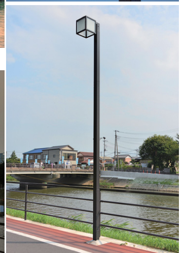
点灯時のLED街路灯特注器具(上) 昼間の地上5.5m高LED街路灯特注器具(下)