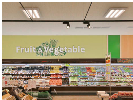
青果売場コーナーのLEDウォールウォッシャーによる照明