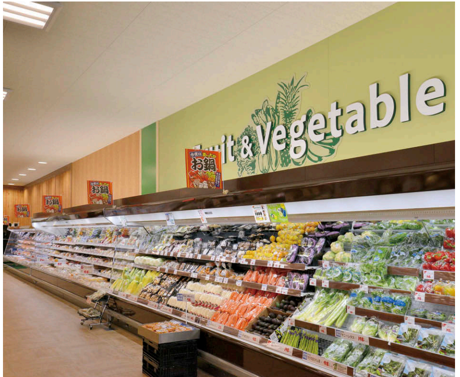
正面奥に位置する鮮魚と精肉コーナーのLEDウォールウォッシャーによる壁面看板および天井面の照明

このほかトイレには人感センサー付のLEDダウンライト、バックヤードならびにエントランスにはLEDベースライトTENQOOシリーズを採用したことで省エネとメンテナンスコストの削減を実現しています。