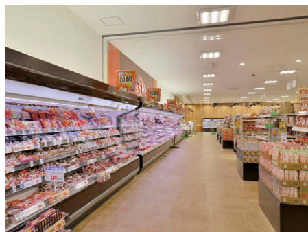
上向き30度にしたLEDウォールウォッシャーによる照明