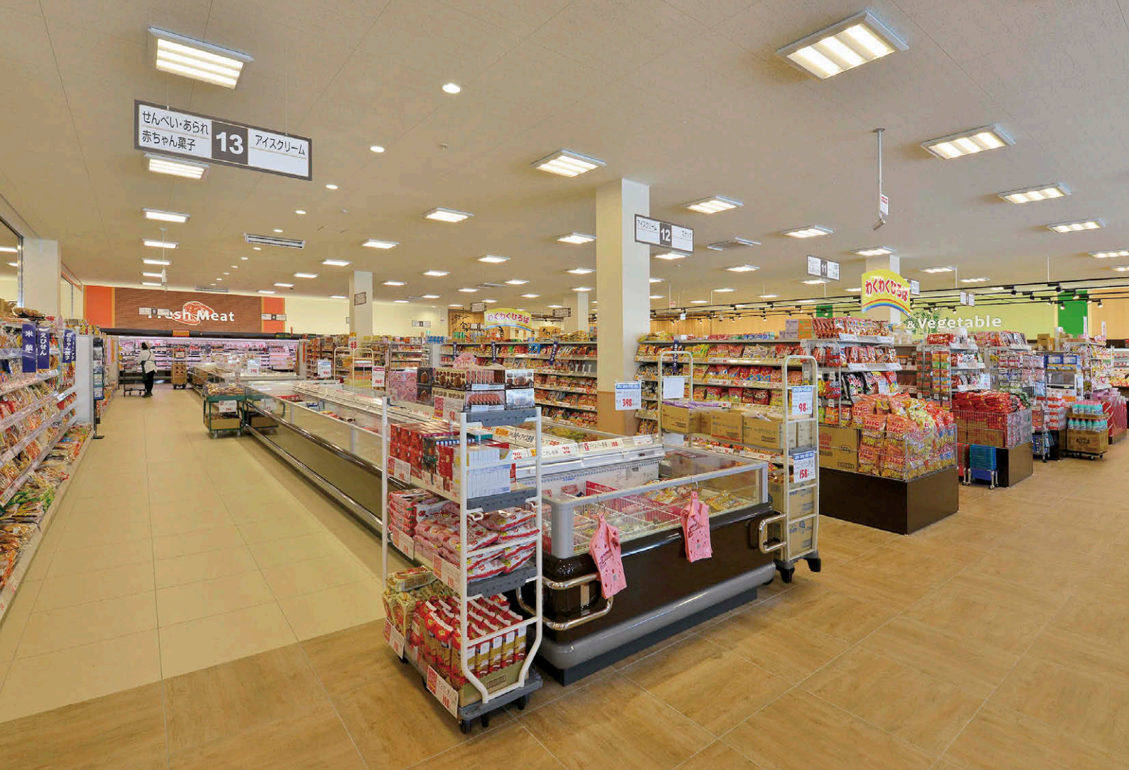
中央売場コーナーのLEDベースライトTENQOOスクエア器具により落ち着いて商品を選択できる光環境を確保