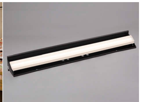
4段階の角度調整可能な特注LEDウォールウォッシャー