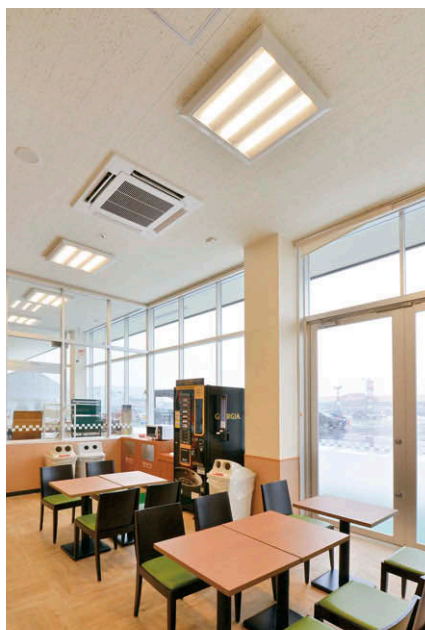
TENQOOスクエア器具を休憩室に配置