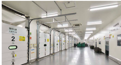
高出力タイプのTENQOOシリーズにより伝票などの視認性も高めた製品出荷場