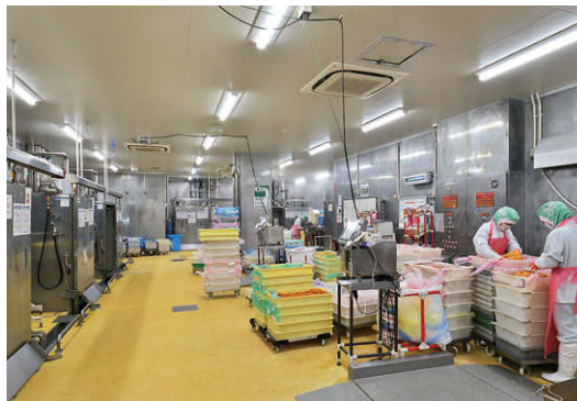
TENQOOシリーズ防湿・防雨器具(ステンレス白色タイプ耐塩形)を配置した冷却室