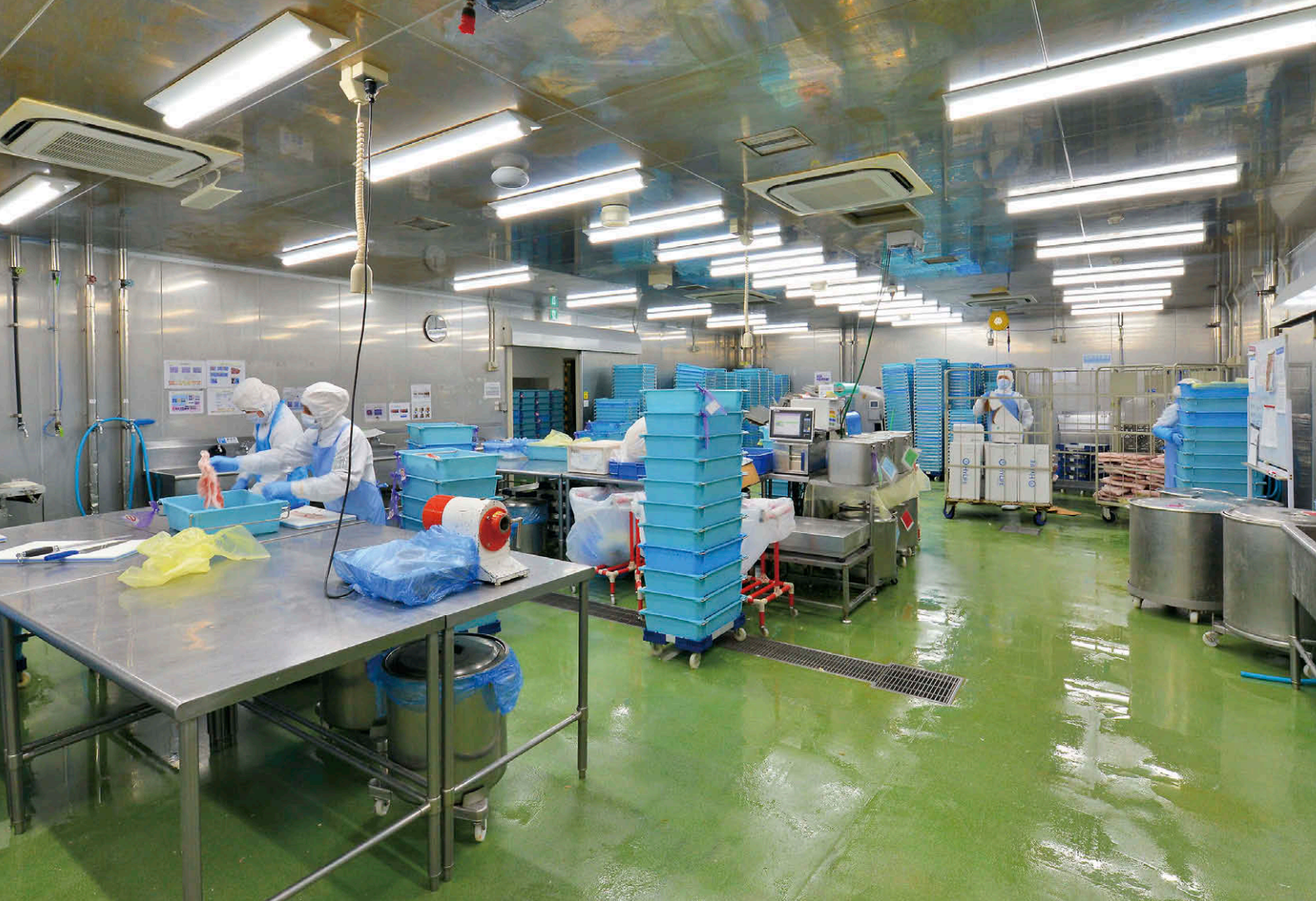
TENQOOシリーズ防湿・防雨器具(ステンレス白色タイプ耐塩形)を配置した魚肉処理室