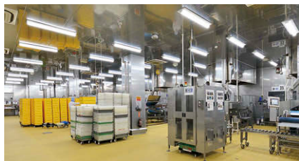
TENQOOシリーズ防湿・防雨器具(ステンレス白色タイプ耐塩形)を配置した舍利冷却室