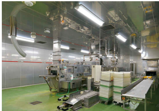
水蒸気の発生する内番重洗浄室にはステンレス白色タイプ耐塩形のTENQOOシリーズ防湿・防雨器具を配置