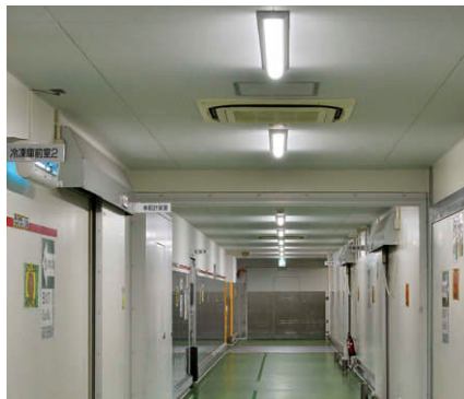
2階通路ではLEDベースライトTENQOOシリーズ直付形W120と人感センサーを組み合わせて使用