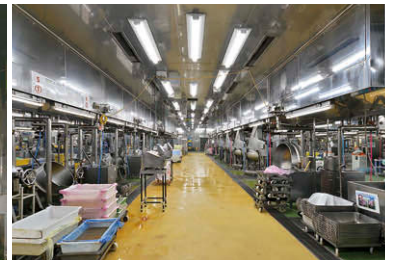
通路天井にTENQOOシリーズ防湿・防雨器具(ステンレス白色タイプ耐塩形)を配置した加熱調理室