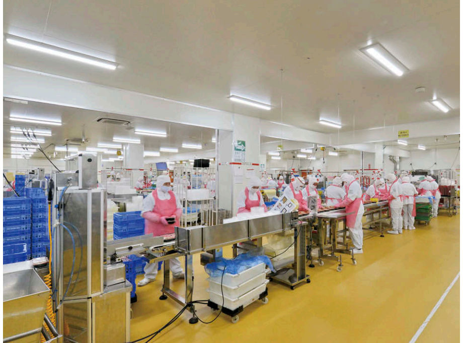
高出力タイプのTENQOOシリーズ直付形により十分な明るさを確保した加工室

2階事務室などのオフィスエリアでは、既設の埋込形器具の取付跡に、リニューアルプレートを用いてLEDベースライトTENQOOシリーズ埋込形(消費電力43.0W)に更新しました。