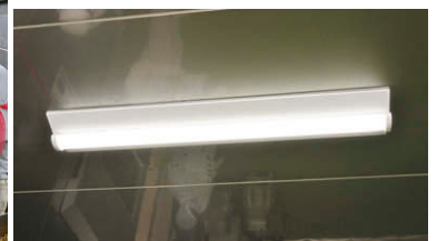
TENQOOシリーズ防湿・防雨器具(ステンレス白色タイプ耐塩形)直付形