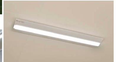
TENQOOシリーズ直付形(高出力タイプ)