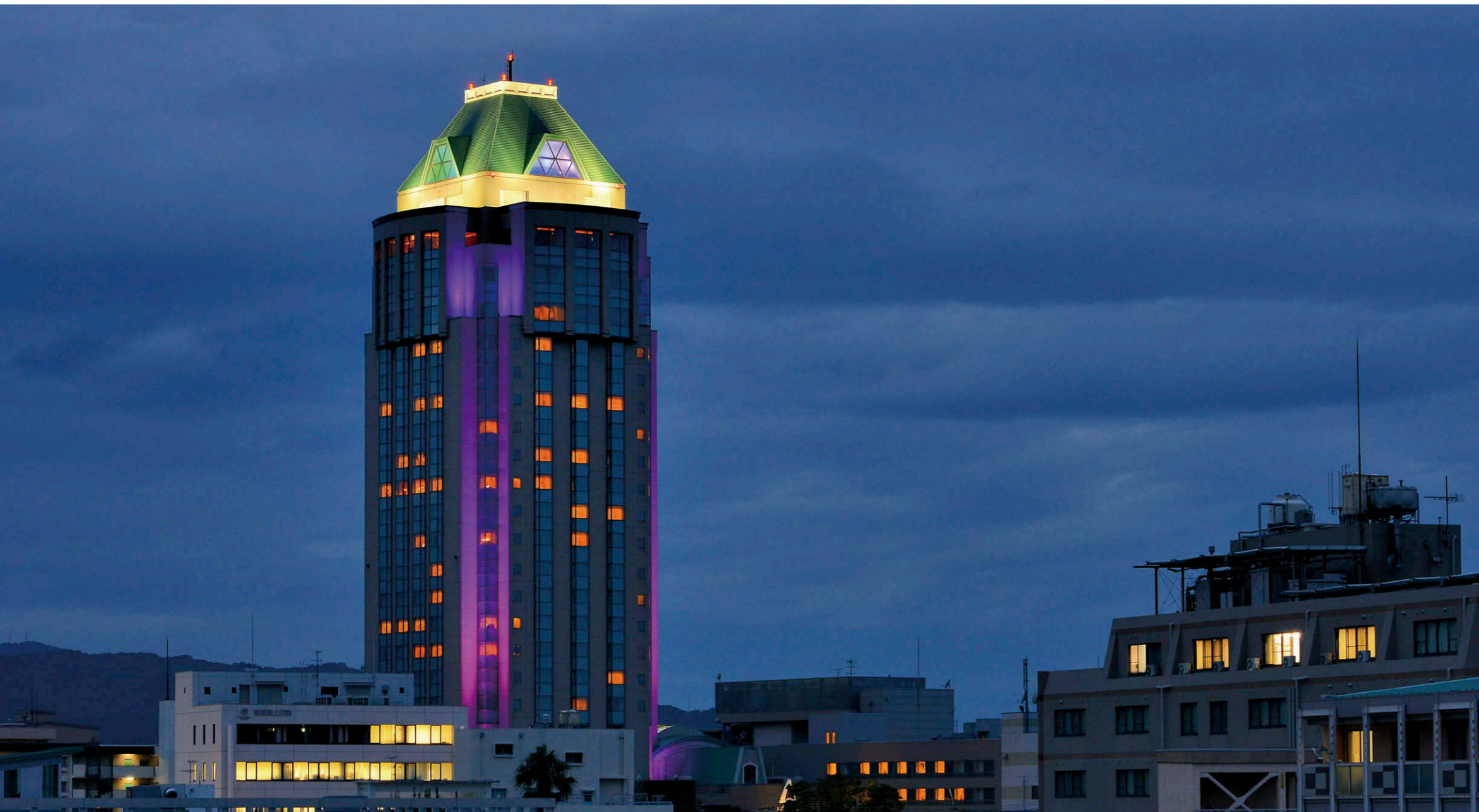
ホテル外観ライトアップ遠景 今治城天守閣付近からホテルを臨む。建物の四隅を駆け上がる2本の光の筋が幻想的かつ多彩な色相変化を見せてくれる

【物件概要】 所在地：愛媛県今治市旭町 2 丁目 3 番地 4 構造・規模：地下 1 階 地上 23 階建 建築主：(株)今治国際ホテル 施工：電気/株式会社 供用開始：2017 年 3 月