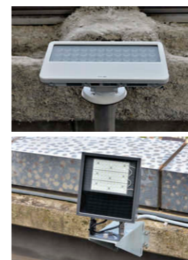
③ ルミライナー-D フルカラーLEDフラッドライト ColorBlast Powercore gen4