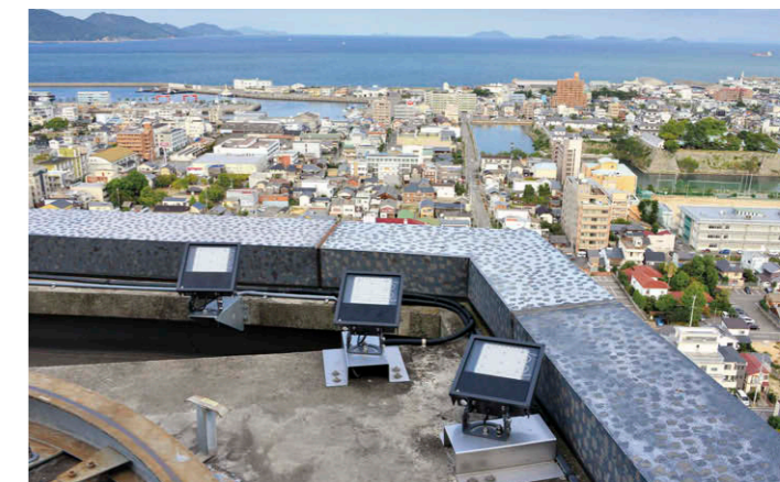
ペントハウスのライトアップ器具 700W 形水銀ランプ器具相当 LED 小形角形投光器 ⑤⑥⑦ を屋上に計 32 台設置し、壁面約 250 ルクス、屋根約 600 ルクスの平均照度を確保